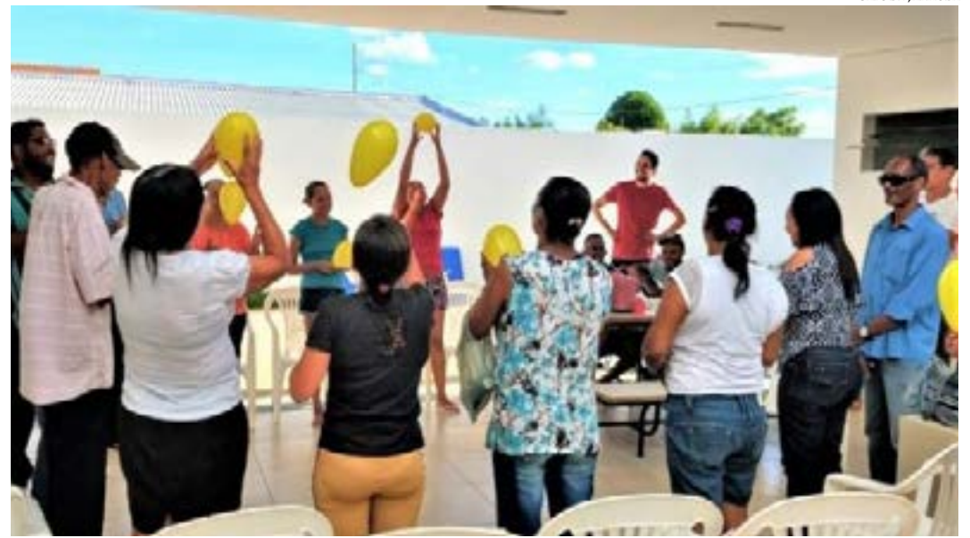
CAPS DE JANAÚBA

Entre outros equipamentos e bens permanentes, a Secretaria Municipal de Saúde poderá adquirir analisador imunológico; aparelho de hemodiálise; audiômetro; berço para recém-nascido; barras paralelas para fisioterapia; cadeira oftalmológica; cama hospitalar; carro maca; mesa para exames; eletrocardiógrafo e grupo gerador. (Ascom SES-MG)