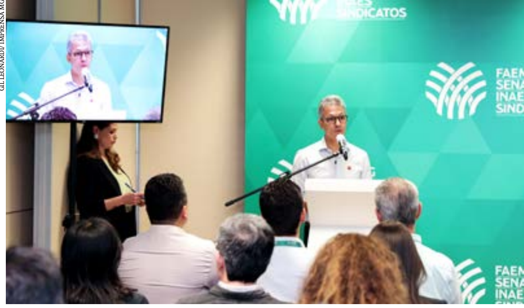
Governador destaca conquistas na área, como estado livre de febre aftosa e evolução nas exportações; valor alcançado no setor representa 22,2% do Produto Interno Bruto total do estado

A apresentação dos resultados foi feita na sede da Faemg, em Belo Horizonte. Antes disso, Romeu Zema também se reuniu com representantes do Sistema Faemg Senar para discutir pautas estratégicas do agro mineiro.