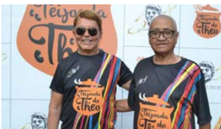
COM o bom amigo, Maçarico