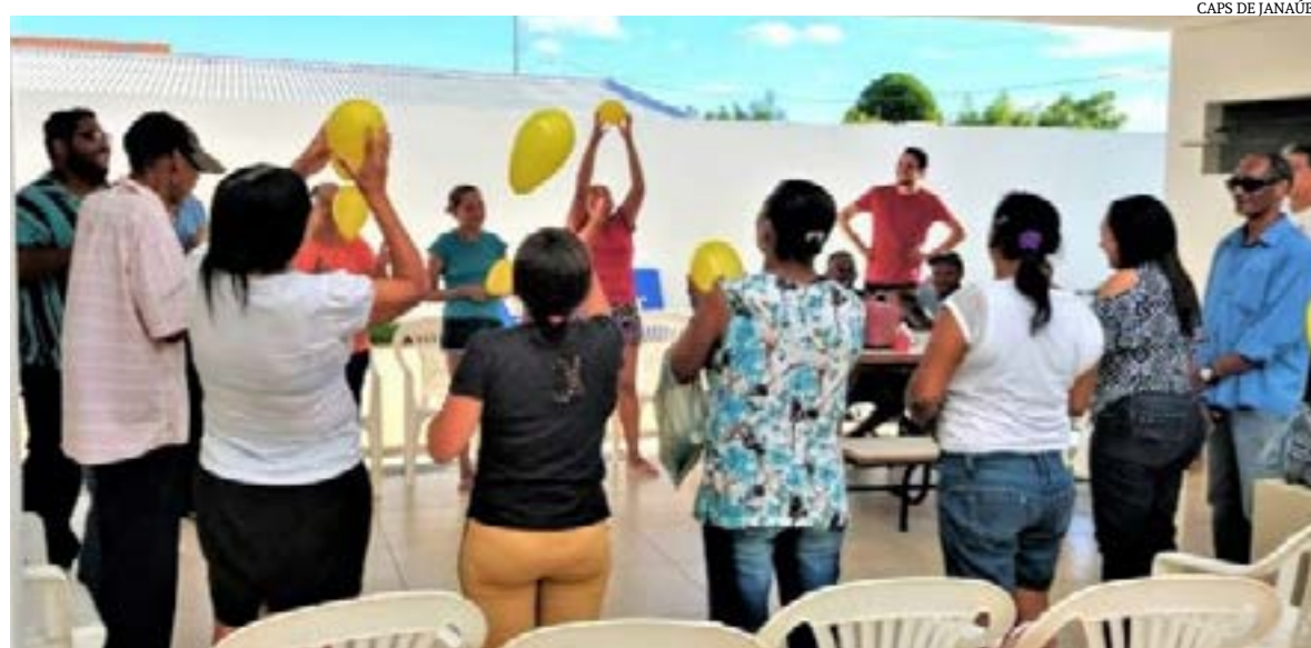
CAPS DE JANAÚBA

Dos mais de 1,6 milhão das pessoas formalizadas como microempreendedores individuais (MEI) em Minas Gerais até o fim de abril, cerca de 3,3 mil são estrangeiras, segundo levantamento do Sebrae Minas com base nos dados do Portal do Empreendedor. Esse número aumentou 24% no estado se comparado com o acumulado do ano passado.