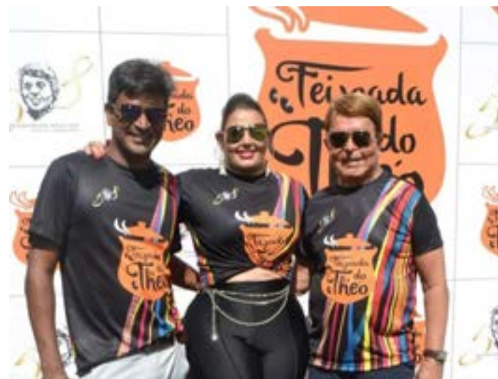
EMOLDURADO por Igor Araújo e Bel Froes