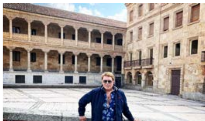
EM FRENTE a um dos antigos conventos de Salamanca, onde o movimento é dos maiores, pois a Universidad recebe alunos de várias partes do mundo