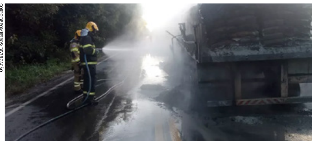
COMUNICADO DIVULGAÇÃO DE BOMBEIROS

Ainda não se sabe a autoria e a motivação que levou a pessoa a atirar contra o rapaz. (OLIVEIRA JÚNIOR - Colaborador)