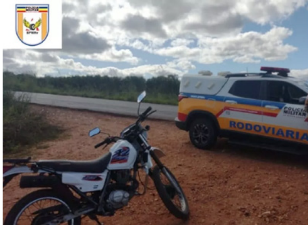
FOLHA MILITAR RODOVIÁRIA

O preso foi levado para a delegacia da Polícia Civil em Espinosa. A moto foi removida para um pátio da cidade.