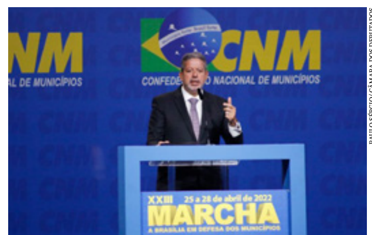
Lira: pauta municipalista tem prioridade na Câmara

No discurso aos prefeitos, no Centro de Convenções, Lira também afirmou que as mudanças aprovadas na Lei de Improbidade Administrativa permitem que bons