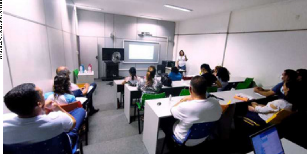
Foram repassados mais de R$ 50 mil para combate ao vetor no município nas modalidades de custeio e investimento

A dengue é uma doença que pode levar a óbito rapidamente, portanto, qualquer sintoma, como febre, dor de cabeça ao redor dos olhos, deve-se procurar uma unidade de saúde. Clique aqui e saiba mais sobre o combate ao mosquito.