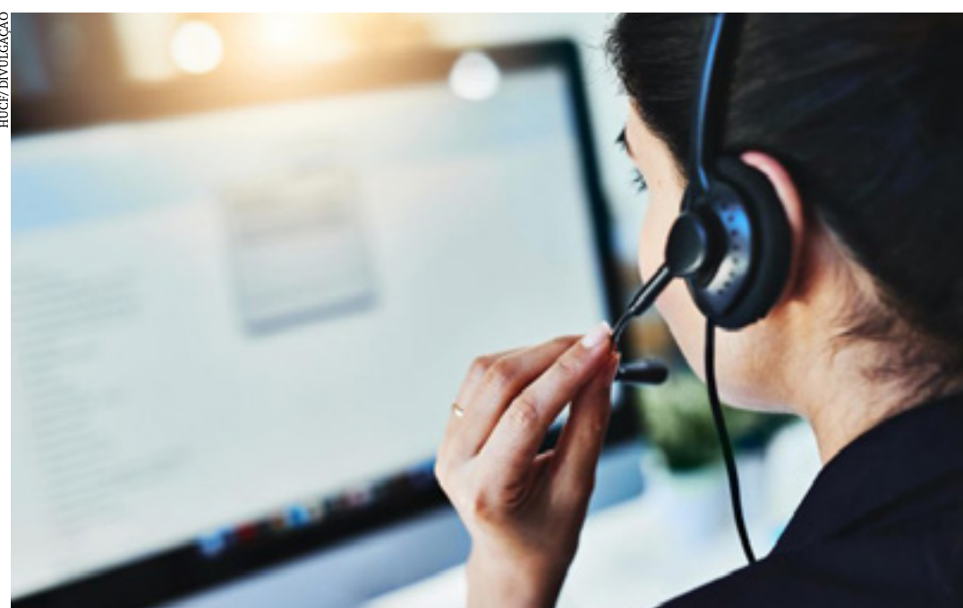
Há vagas para jornada presencial e home office. Candidatos devem ter mais de 18 anos e Ensino Médio completo

PROVA | O concurso acontecerá em etapa única, por meio de prova objetiva de múltipla escolha, de caráter eliminatório e classificatório. A prova terá 40 questões, de língua portuguesa, legislação básica e conhecimentos específicos de cada cargo. A prova será aplicada no dia 26 de junho, em Montes Claros, Araçuaí e Arinos. (Ascom IFNMG)