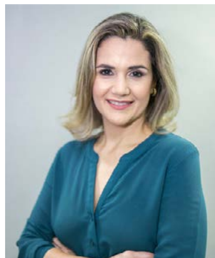
Segundo a especialista, o exame se realizado rotineiramente pela mulher, diminui o risco de pela doença

Segundo o Instituto Brasileiro de Geografia e Estatística (IBGE), a expectativa de vida dos brasileiros vem aumentando e a das mulheres é 80,3 anos. "Temos, portanto, uma população cada vez mais idosa e com melhor expectativa de vida. Assim, o seguimento com mamografia de rastreamento deveria ser descontinuado em mulheres com expectativa de vida menor que 5 anos e avaliada individualmente em mulheres acima de 75 anos", finaliza a especialista.