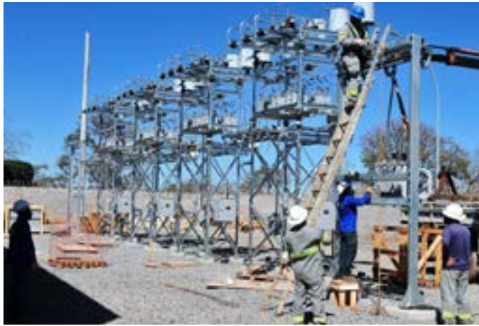
É esperada a geração quase 32 mil empregos diretos no total, durante as obras de construção e manutenção das linhas de transmissão e subestações, especialmente no Norte de MG