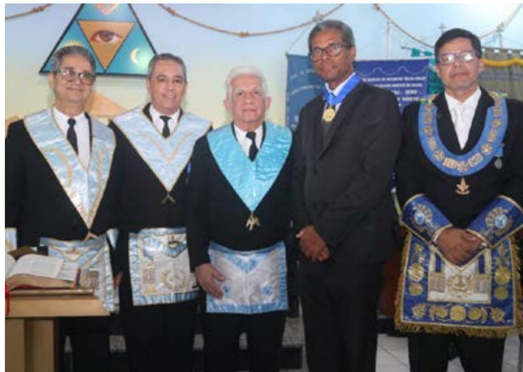
A Universidade Estadual de Montes Claros (Unimontes) foi homenageada na noite de quinta-feira, pelos serviços prestados aos longos de 60 anos de sua história.