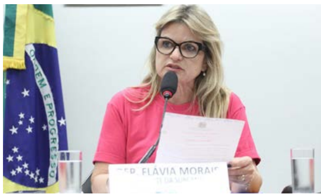
VINCICIUS LOURENS/CÂMARA DOS DEPUTADOS

para participar do programa, por até três horas semanais, orientarão e acompanharão os beneficiários do programa na escola onde lecionam. As atividades físicas deverão