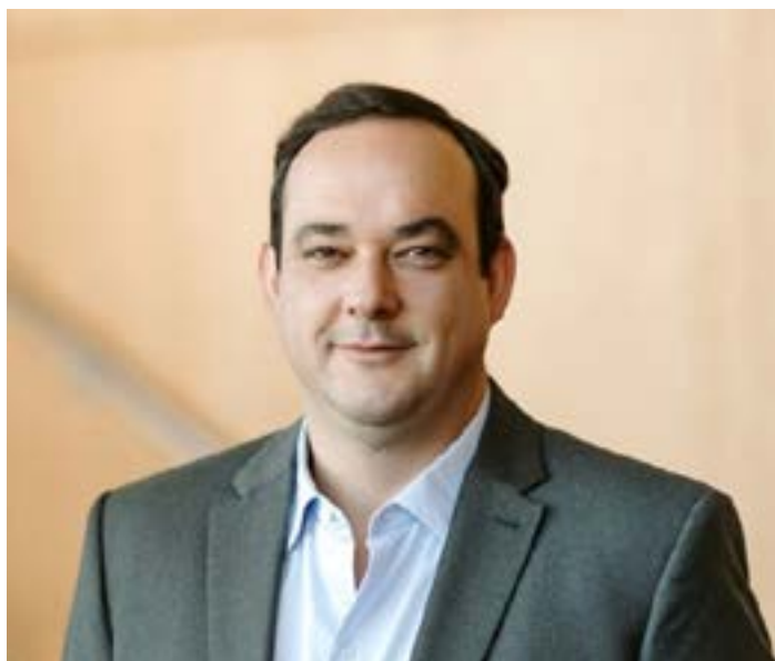
Flávio Roscoe - Presidente da FIEMMG

A FIEMMG reforça o apelo para que deputados e senadores tomem a decisão certa: manter os vetos e eliminar definitivamente os dispositivos que comprometem o desenvolvimento sustentável do Brasil.