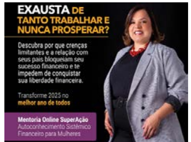
Palestrante, mentora, educadora e terapeuta financeira, especializada em finanças comportamentais e psicologia financeira

Em suma, o empreendedorismo feminino em Montes Claros é uma realidade em crescimento, impulsionada pela busca por autonomia e oportunidades. Apesar dos desafios, as mulheres da cidade têm demonstrado resiliência, criatividade e coragem para inovar, criando negócios que não apenas geram emprego e renda, mas também contribuem para a transformação social e econômica da região.