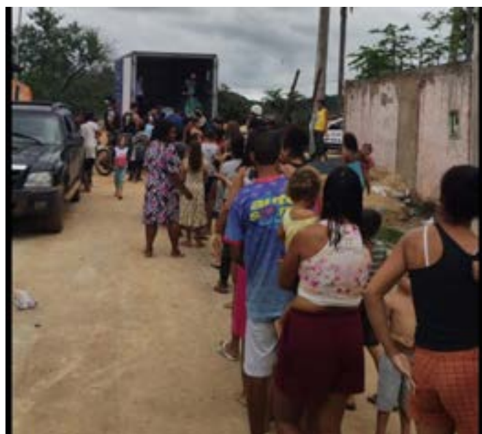
AINDA ESSA SEMANA estarei novamente como acontece há várias décadas fazendo a distribuição de brinquedos para fazer a alegria das crianças carentes neste Natal.