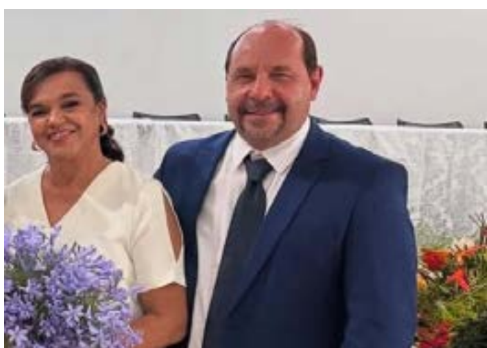
EM RECENTE ENCONTRO O ENGENHEIRO e Prefeito eleito com sua esposa Euna. Dia primeiro Guilherme toma posse como novo Prefeito de Montes Claros com o apoio de toda população Enquanto isso corre aí os números dos possíveis novos secretários, mas acho bom esperar a lista oficial que será lançada pelo novo Prefeito. os empresários brasileiros dizendo que o Brasil cobra altas tarifas sobre produtos que importa do seu País. Sobre isso ele já disse que seu governo vai cobrar as mesmas tarifas dos nossos produtos. Trump realmente sabe das coisas e gosto dele, estava torcendo pela sua. Na foto ele e o ex-presidente Bolsonaro.