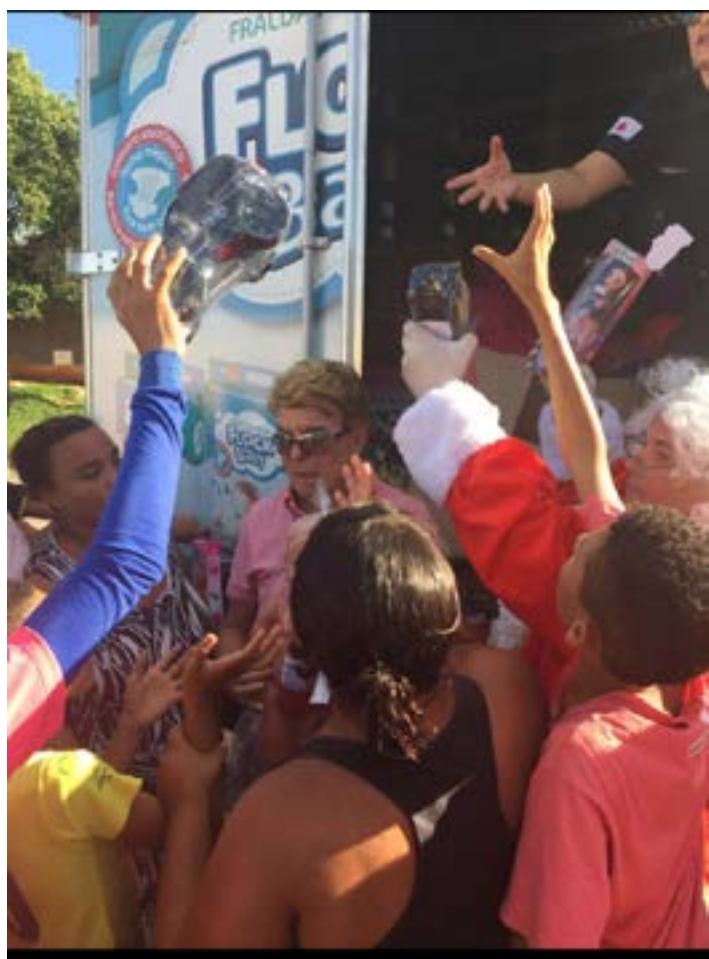
VEJAM A ALEGRIA DAS CRIANÇAS e dos seus pais quando faço a distribuição dos brinquedos. Vários amigos estão prometendo me ajudar este ano na campanha de Natal.