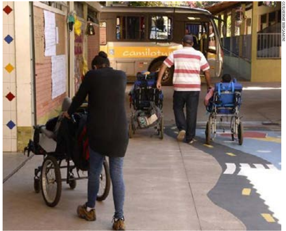
A capacitação e a oferta de postos de trabalho para pessoas com deficiência serão debatidas