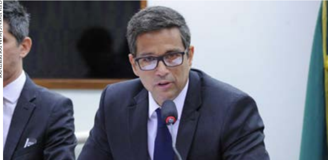
Roberto Campos Neto, presidente do Banco Central

Deputado alerta para inflação de 1,73% em abril e aumentos consecutivos na taxa de juros