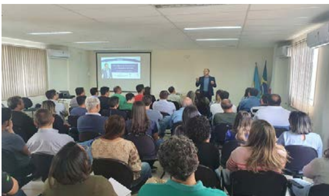
Supram Norte promove palestra Inteligência Emocional e o Impacto na vida para servidores do Sisema sediados no Norte de Minas

O palestrante concorda ser preciso motivação para todos