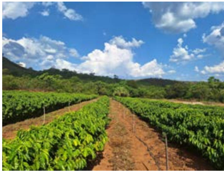
Produção de café na região tem sido otimizada com novas técnicas de manejo

Dois produtores rurais da cidade de Serranópolis de Minas foram premiados no 8º Cupping de Cafés Especiais do ATeG Café+Forte, realizado pelo Sistema Faemg Senar durante a Semana Internacional do Café (SIC), em Belo Horizonte. Os produtores receberam as premiações, em primeiro e segundo lugar, na categoria regional Chapada, com café tipo Cereja Descascado, desbancando outras cidades do estado com potencial produtivo diversificado.