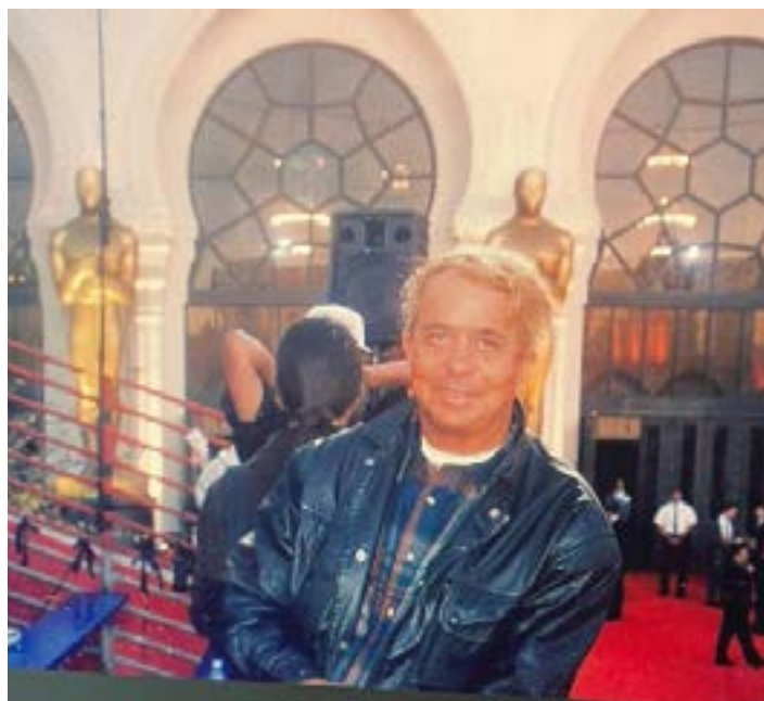
RECORDANDO A FAMOSA FESTA do OSCAR em Hollywood no ano de 1998 quando consegui ficar nos camarotes em frente ao tapete vermelho para ver o desfile das estrelas