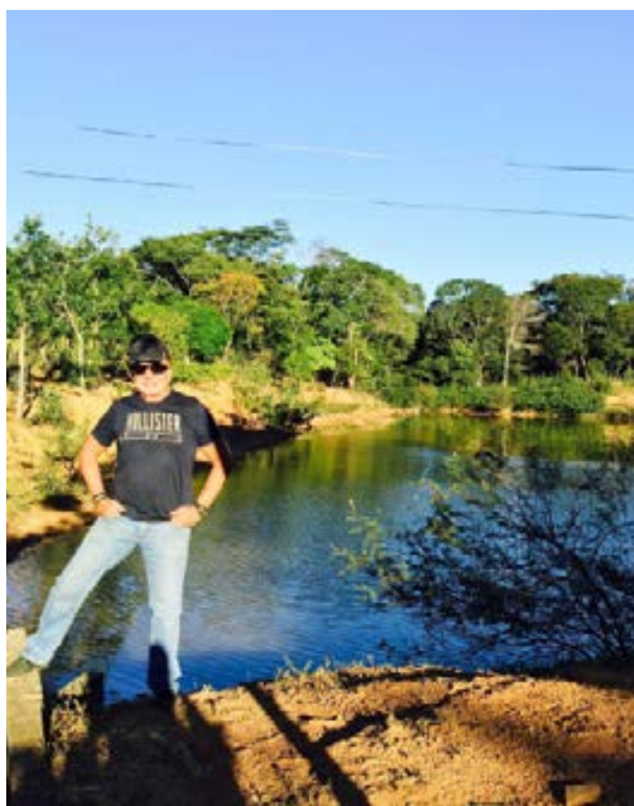
NO FERIADO FUI EM MINHA "roça" e fiquei contente em ver que devido as chuvas o lago está cheio e tudo verde.