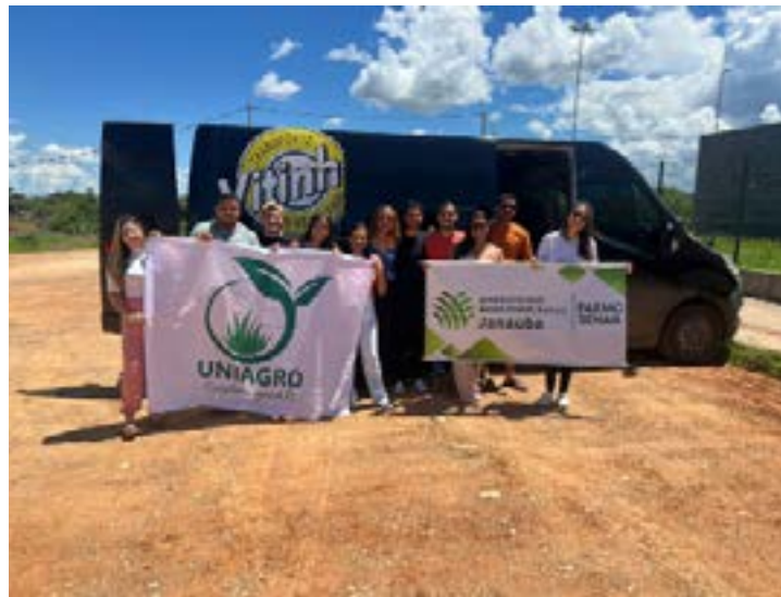
Equipe Uniagro Júnior de Janaúba

Dezenas de jovens estudantes do Norte de Minas participaram da solenidade de premiação da segunda edição da Maratona Faemg Jovem, em Belo Horizonte. Com o tema "Pensar globalmente, agir localmente", o objetivo da ação é aproximar os jovens dos sindicatos rurais e do agronegócio, buscando formar futuros líderes para o setor. "Vivenciar o agro é saber que somos responsáveis pela segurança alimentar de milhões de pessoas. E participar de eventos como a Maratona Faemg Jovem é colocar isso em prática, através de nós, jovens agentes de transformação, levando