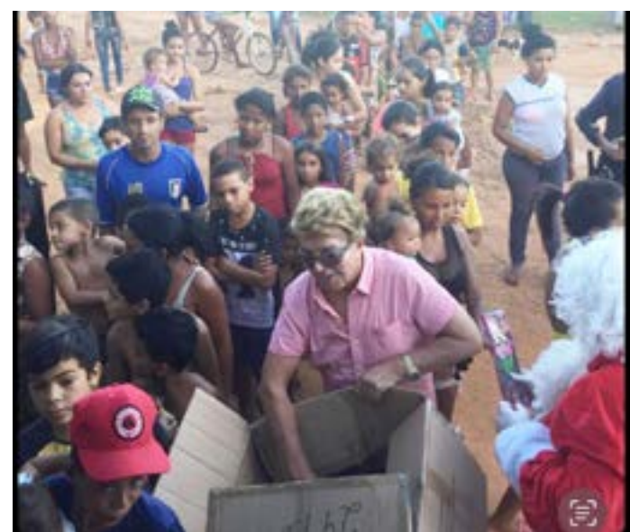
ESTE JORNALISTA DISTRIBUINDO brinquedos para as crianças carentes na "Campanha do Natal" que é realizada há mais de 50 Anos. No próximo mês voltarei visitando os bairros da periferia para fazer a alegria de todos no Natal. Espero contar novamente com a participação de todos me enviando brinquedos