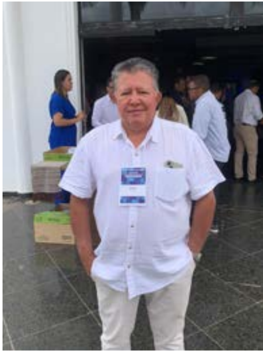
Prefeito Elivaldo de Patis