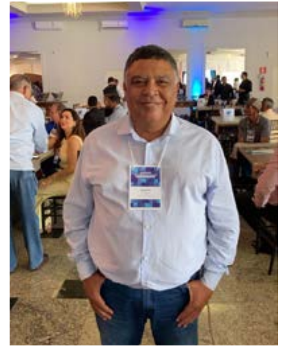
Prefeito Vanderlei de Claro dos Poções