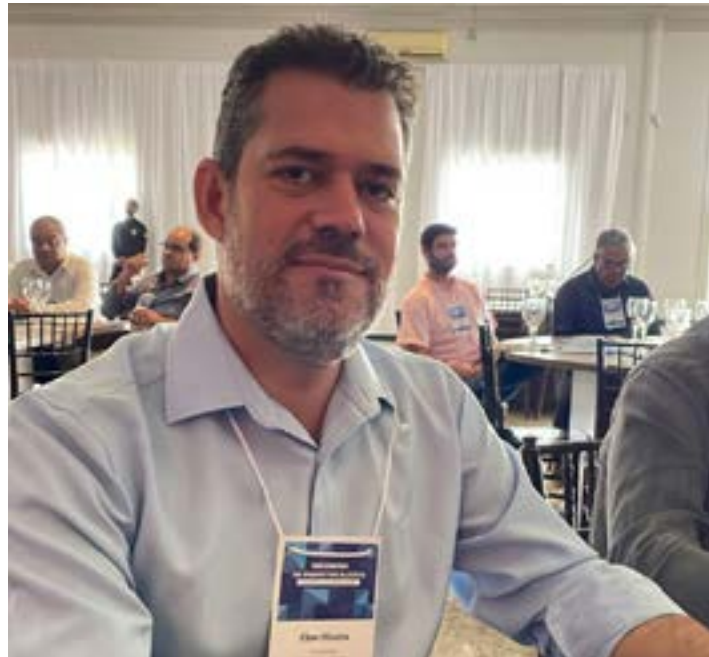
Prefeito Elber Oliveira de Cabeceira Grande