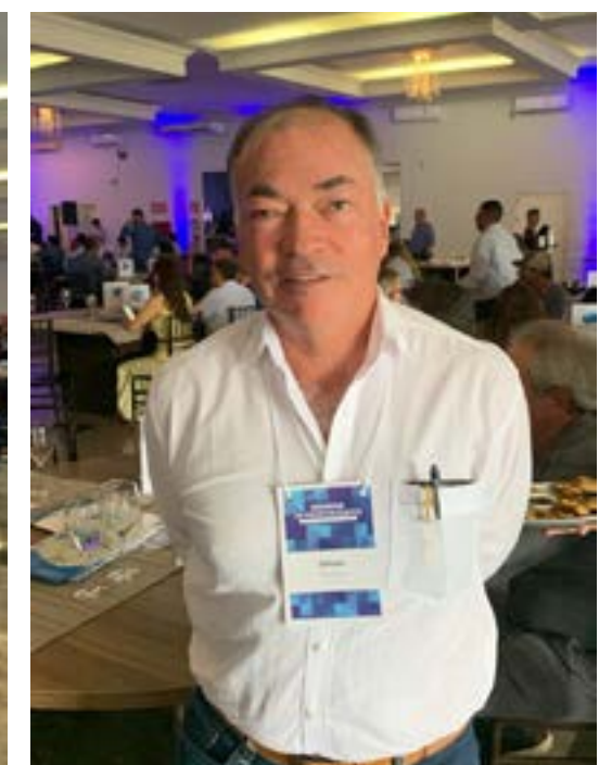
Prefeito Dinarte de Formosa