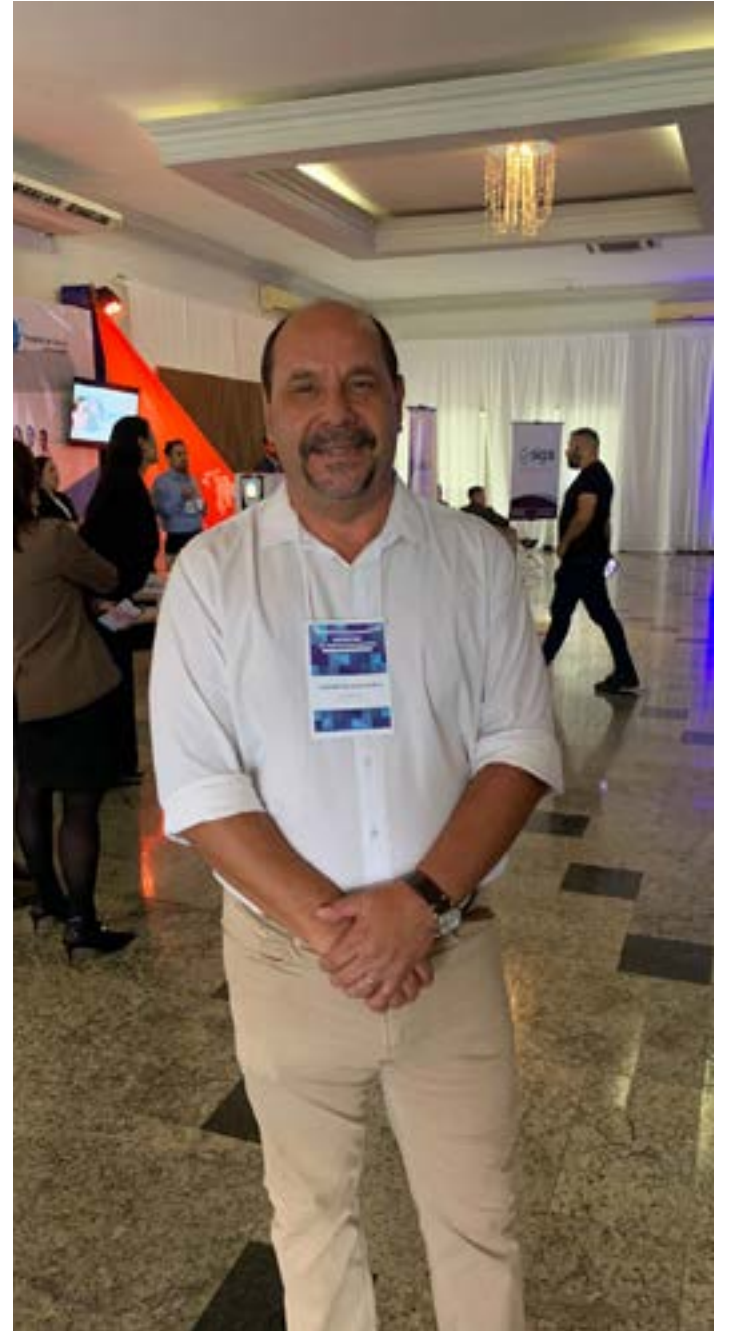
Prefeito Guilherme Guimarães de Montes Claros