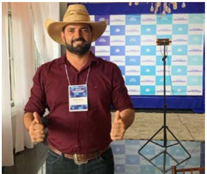
Prefeito Rone de Chapada Gaúcha