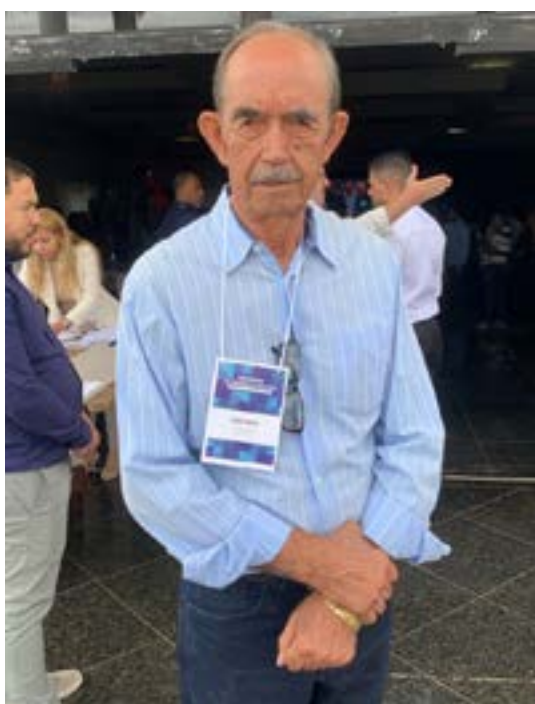
Prefeito Elzio de Miravânia