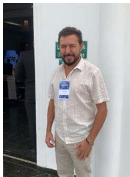
Prefeito Kinca Dias de Salinas