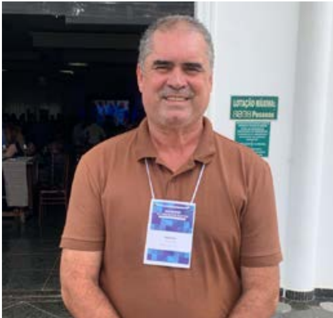
Prefeito Marlon Fruta De Leite