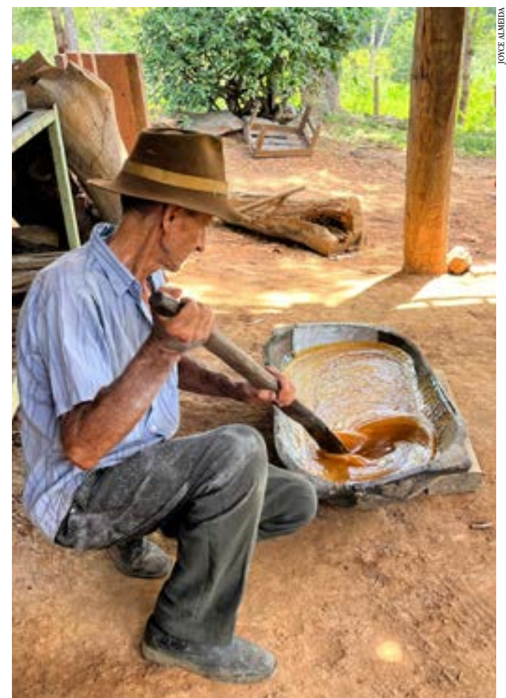
Produção de rapadura, na comunidade de Santa Bárbara II