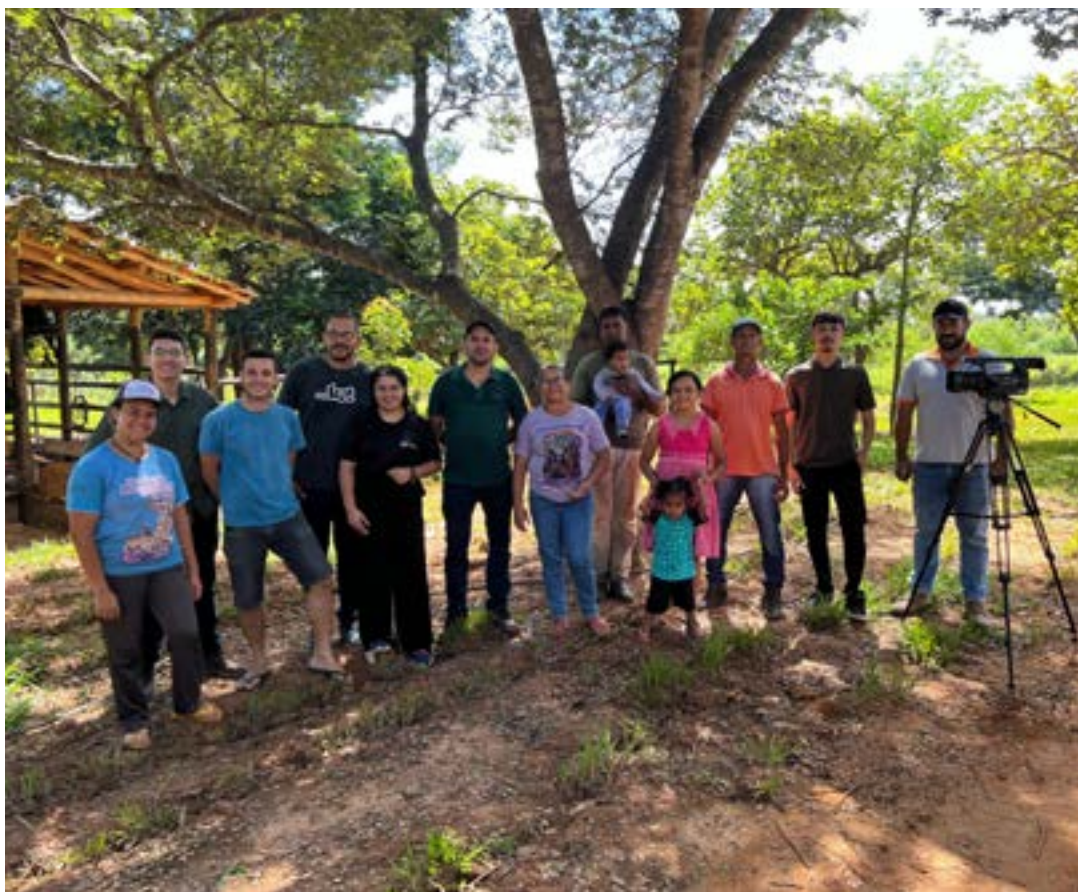
Bastidores de um dos dias de gravações do documentário; registro na comunidade rural de São João da Vereda