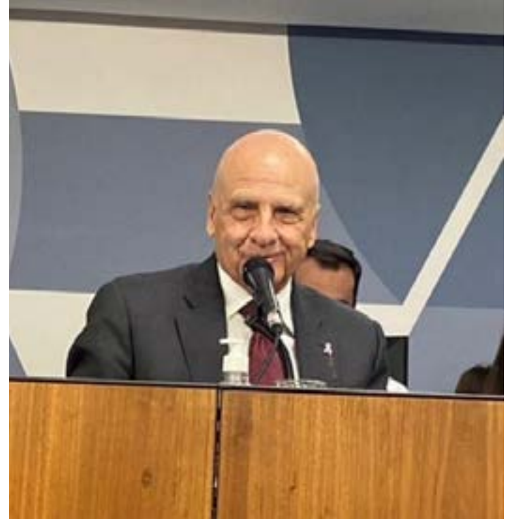
EQUIPE ARLEN SANTIAGO

Durante a reunião, o parlamentar também citou a Emenda à Constituição nº 114/2023, aprovada pela Assembleia Legislativa no início de 2024, que autoriza o repasse de recursos das emendas parlamentares impositivas, mesmo em ano eleitoral, para hospitais filantrópicos, Associações de Pais e Amigos dos Excepcionais (Apaes), asilos e outras organizações da sociedade civil, desde que não envolva a distribuição gratuita de bens e valores. Para o Deputado, a PEC também tem sua importância para os hospitais do estado na luta contra o câncer de mama.