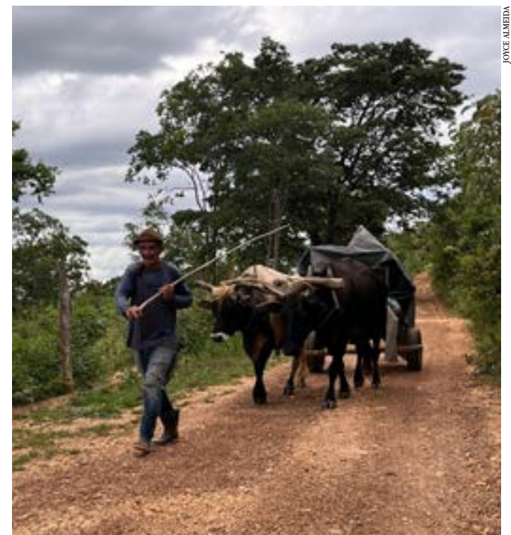
Cena do documentário

O documentário “50 ANOS DE LUTA” está disponível no canal do YouTube STRMOC e conta os detalhes, até então nunca revelados, sobre os bastidores políticos, embates judiciais, e o mais importante, sobre como a vida era e ainda é, na zona rural de Montes Claros.