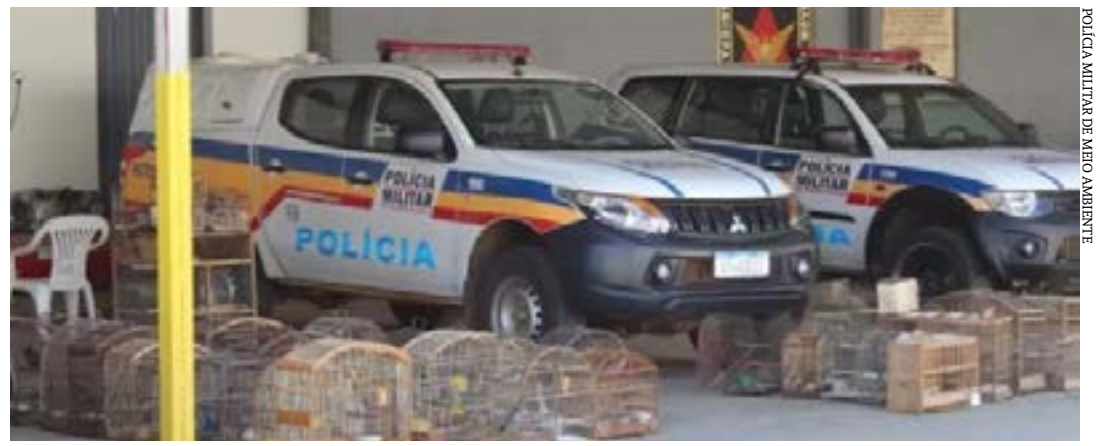
POLÍCIA MILITAR DE MEIO AMBIENTE

O homem foi qualificado no boletim de ocorrência e o caso será repassado para a Polícia Civil. A avaliação de um veterinário determinará se os pássaros, que aparentam ter sido capturados recentemente, poderão ser devolvidos à natureza. Se isso não for possível, a PM de Meio Ambiente fará o encaminhamento para o Centro de Triagem de Animais Silvestres de Montes Claros.