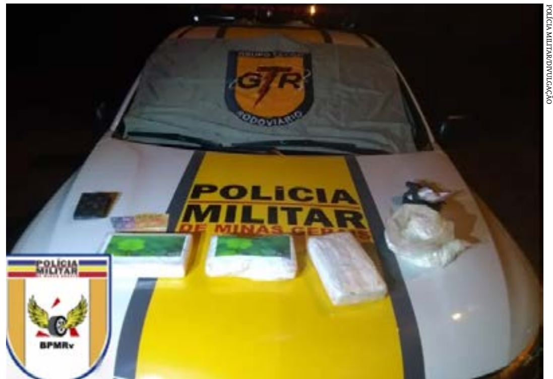
POLÍCIA MILITAR DE MONTES CLAROS

cos plásticos. Ainda de acordo com a PM, o jovem contou que receberia R$ 500 para buscar a droga no Distrito de Nova Esperança e disse que era a primeira vez que fazia este tipo de transporte. Ele foi preso em flagrante e conduzido à delegacia de Polícia Civil. A motocicleta foi removida ao pátio credenciado ao Detran.