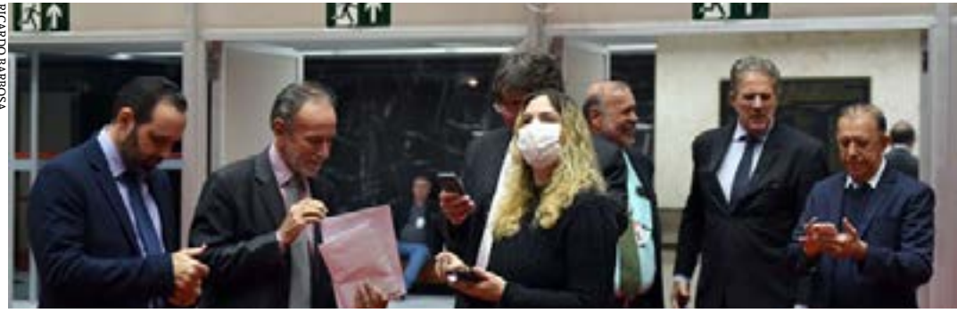
Projetos sobre doações de imóveis e sobre reconhecimento como de relevante interesse cultural também foram analisados pelos deputados

O Plenário da Assembleia Legislativa de Minas Gerais (ALMG) aprovou, em 2º turno, durante Reunião Extraordinária na manhã desta quarta-feira (25/5/22), o Projeto de Lei (PL) 3.065/21, que institui o Polo Agroecológico e de Produção Orgânica da região Norte do Estado.