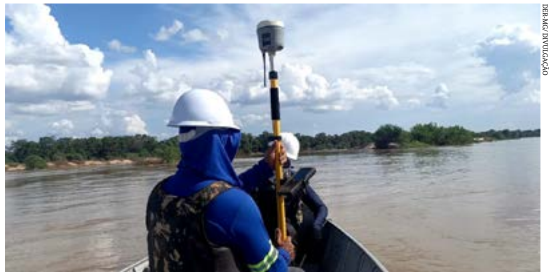
Estrutura sobre o Rio São Francisco, na rodovia MG-402, será uma das maiores erguidas pelo estado; investimento é de R$ 137 milhões

Os recursos, da ordem de R$ 2 bilhões, são oriundos do Termo de Reparação assinado com a Vale em decorrência do rompimento da barragem de Brumadinho, do Termo de Transação e de Ajustamento de Conduta (TTAC) firmado entre o Governo de Minas e a Fundação Renova, além de convênios e emendas parlamentares estaduais e federais, parcerias com empresas e convênios com prefeituras. (Agência Minas)