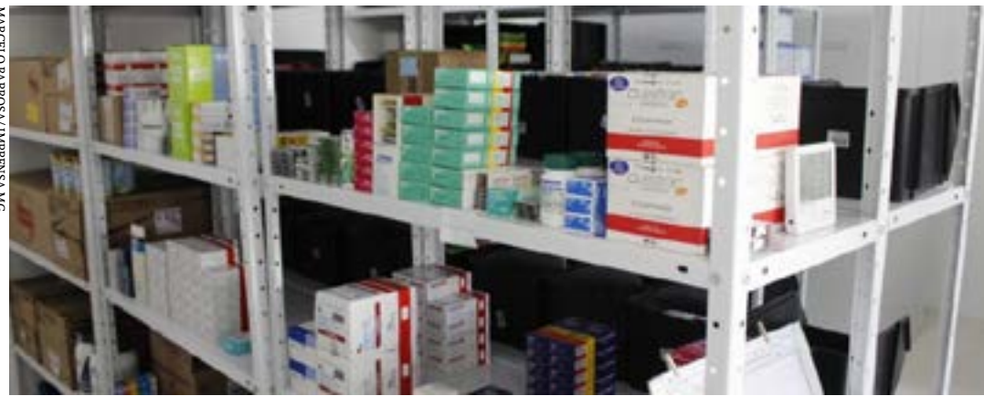
Norma já é válida em 391 cidades, onde vai beneficiar 85 mil pacientes; ação também destina até R$ 140 mil para compra de equipamentos e obras em farmácias públicas