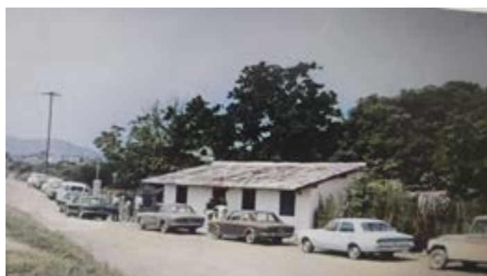
RECORDAR É VIVER: quem lembra do " Theo's House", que era um complexo de bar, boate, praça de eventos, restaurante e grande pista de patins. Tudo num espaço de mil metros e foi da minha propriedade durante mais de 10 anos. Bons tempos.