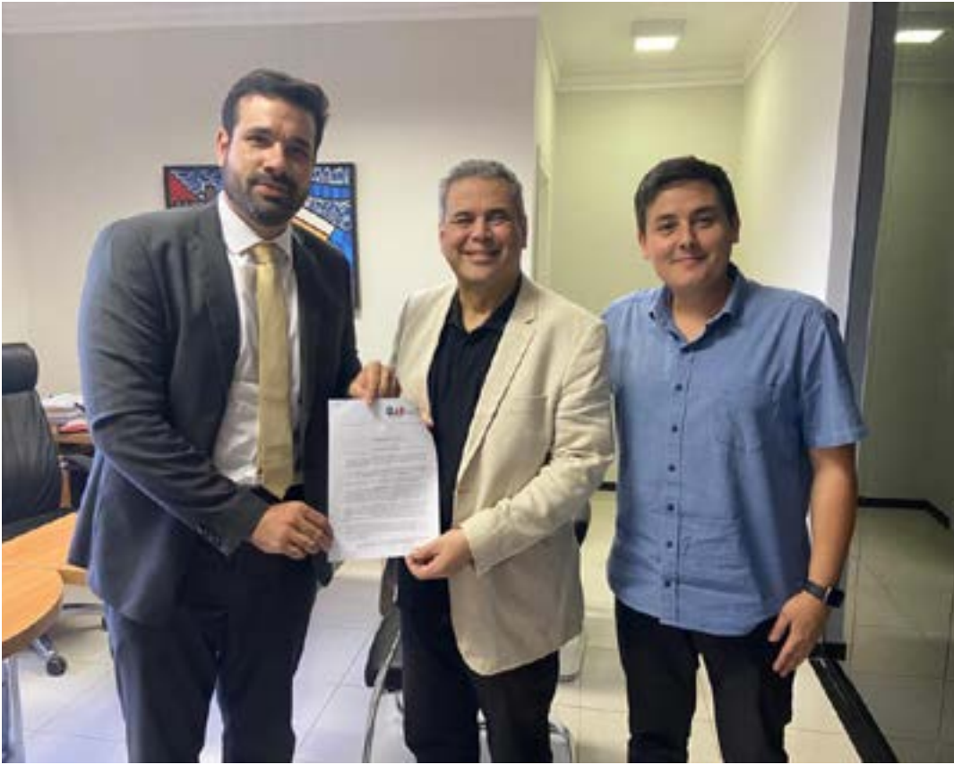
Requerimento entregue ao desembargador Lailson Baeta