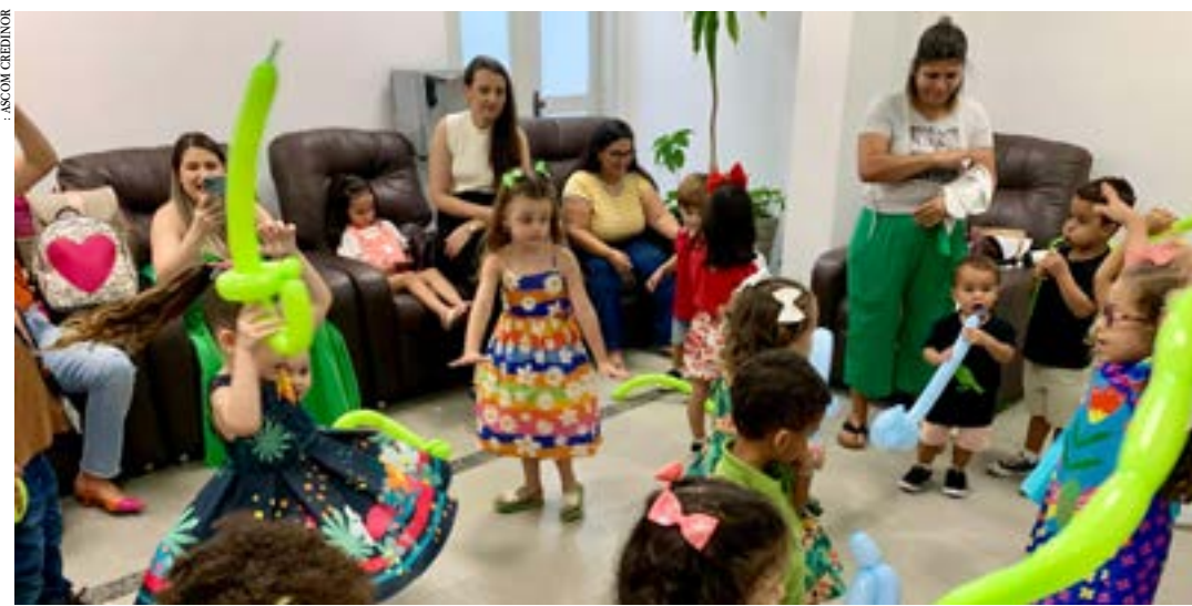
As crianças de até 4 anos tiveram uma tarde cheia de cores, brincadeiras e muita alegria

Ação voltada para filhos de colaboradores atenderá cerca de 120 crianças até o final deste mês