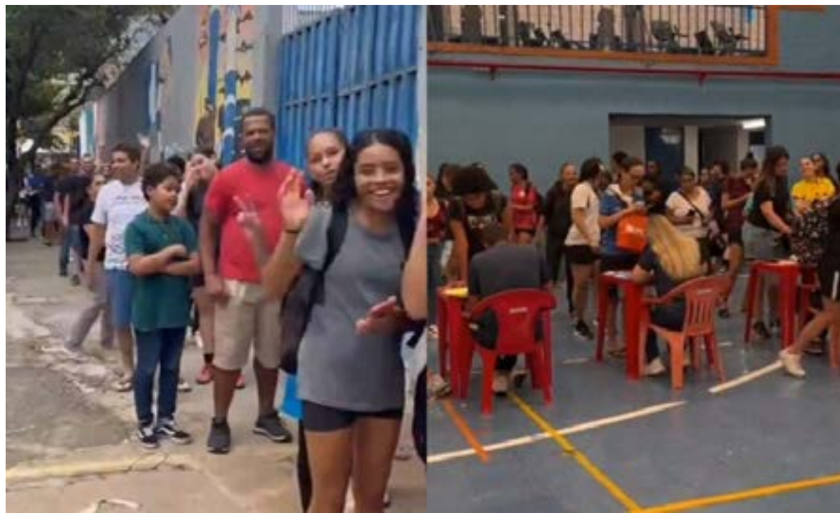
Mais de 400 mulheres se inscreveram para tentar conseguir uma vaga no novo projeto do Cruzeiro.

Cruzeiro realiza seletiva com mais de 400 atletas para novo projeto