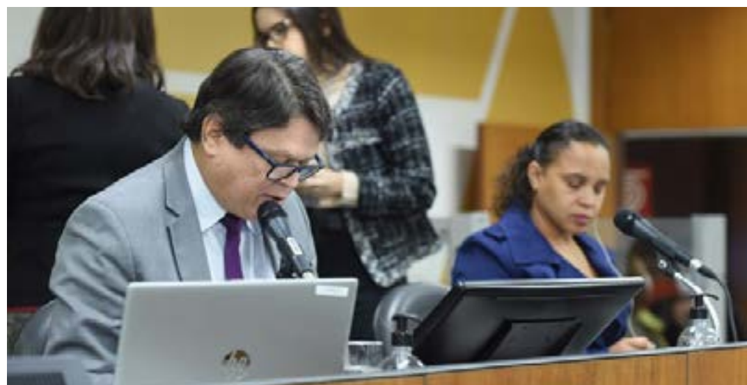
O parecer do deputado Zé Guilherme (PP) foi pela aprovação do PL 1.187/19 na forma do substitutivo nº 2, que apresentou

“De fato há problemas de excesso de demanda e defasagem nos preços de OPMs, dificultan-