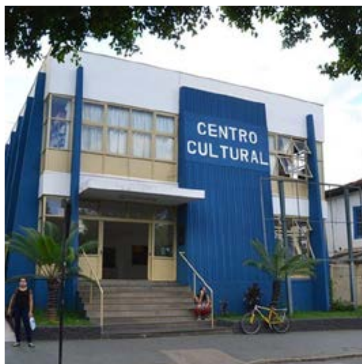
A mais tradicional casa de cultura de Montes Claros, o Centro Cultural pede socorro