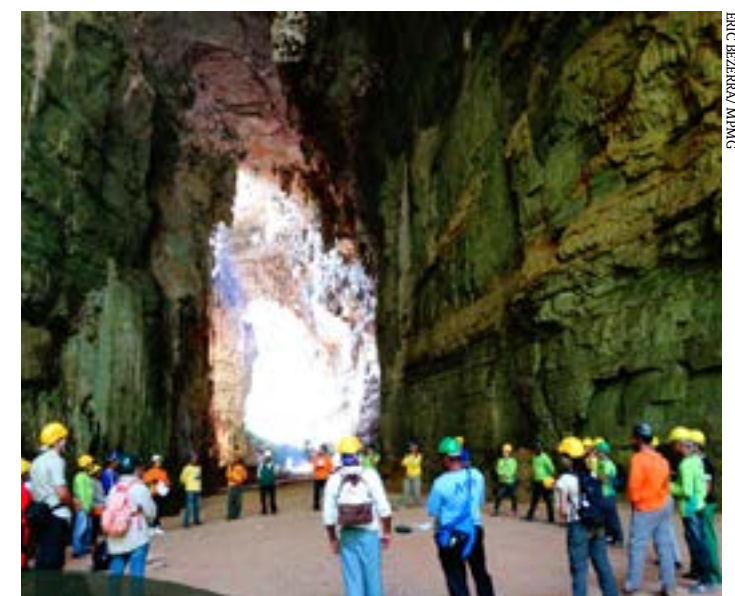
Encontro inclui visita técnica ao Peruaçu

8h: visita técnica ao Parque Nacional Cavernas do Peruaçu (Agência Sebrae)