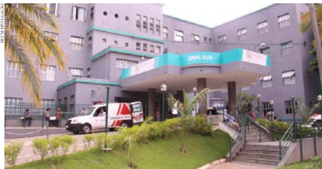
O Hospital Universitário de Ciências Médicas é uma das instituições que será contemplada com projeto de eficiência energética por meio da Chamada Pública de Eficiência Energética de 2024, da Cemig

Para se ter uma ideia da relevância do Programa, em todo esse tempo ele já foi responsável pela economia de 7.423 giga-whats-hora (GWh), energia suficiente para abastecer, durante um ano, cerca de 3,5 milhões de clientes. Outro dado importante é que, no período de 25 anos, a companhia contribuiu para que 520 mil toneladas de CO2 não fossem liberadas na atmosfera. Em uma leitura mais prática, o valor é equivalente ao carbono absorvido por 3,7 milhões de árvores da mata atlântica em 20 anos.