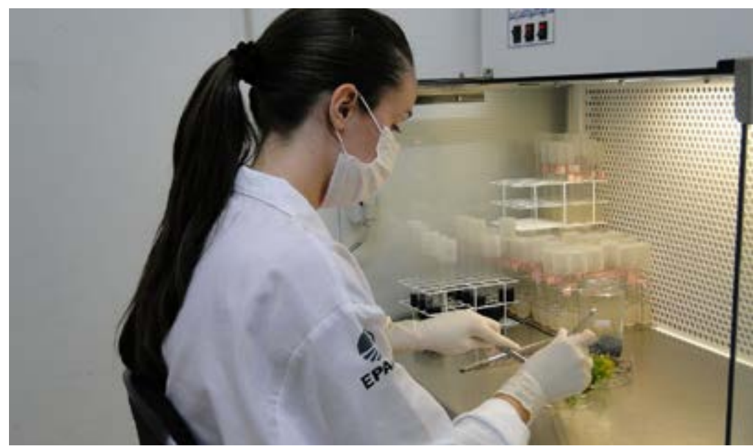
Objetivo do Programa é utilizar recursos biotecnológicos modernos para otimizar a produção agropecuária em Minas Gerais