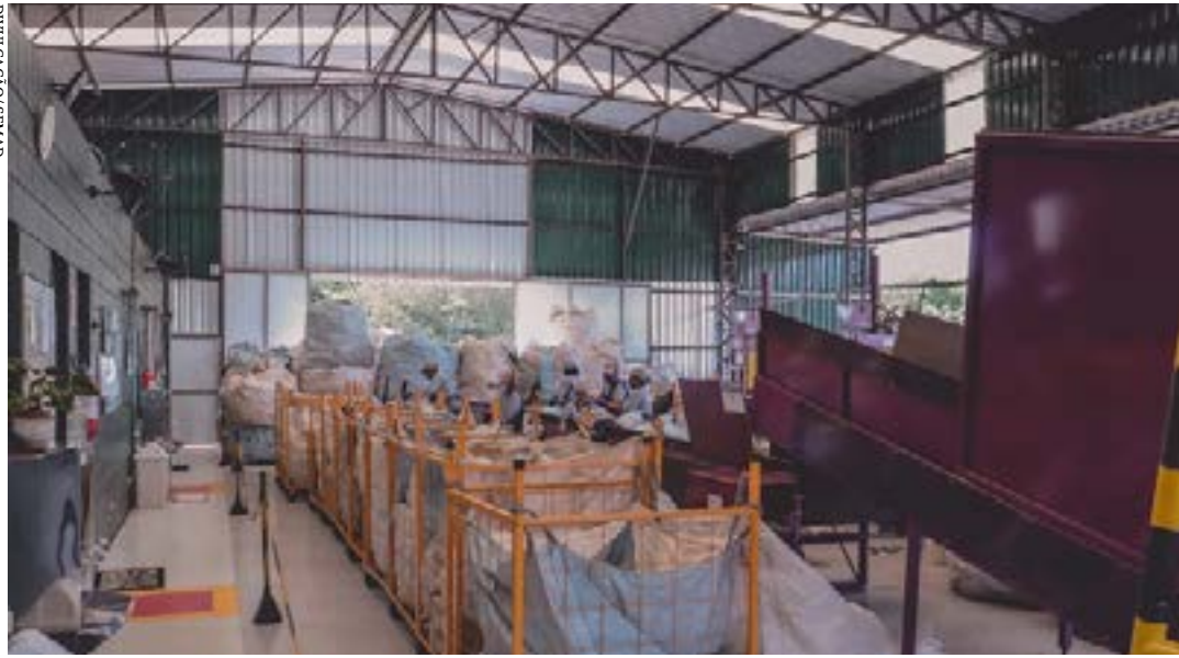
Edital seleciona consórcio para receber projeto de estruturação de sistema de coleta, transporte, tratamento e destinação de resíduos sólidos urbanos