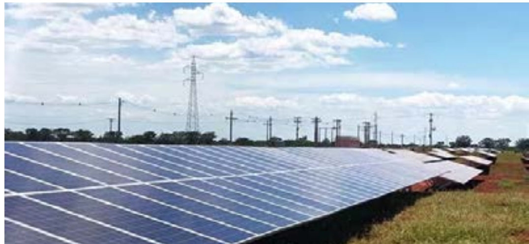
A geração própria de energia solar (GD) já movimentou, em MG, mais de R$ 8,8 bilhões em novos investimentos, gerando mais de 50,6 mil empregos, desde a REN 482/2012

Campeão nacional, Estado responde agora por 16,8% da potência instalada em GD no país, que atingiu 1 milhão de sistemas em telhados de casas, empresas e propriedades rurais