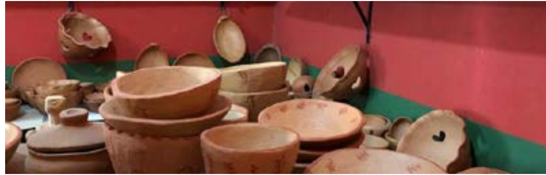
Governo do Estado e Sebrae Minas são parceiros para realização da Trip to Origin; iniciativa valoriza a identidade, além de gerar novas oportunidades de negócios