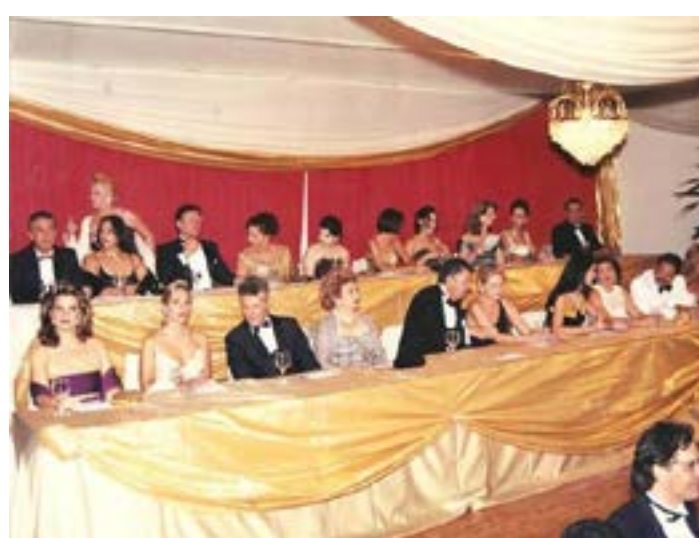
O GRANDE destaque da festa era sempre a mesa de honra que reunia nomes famosos daqui de Moc e da sociedade brasileira; BH, Rio e Brasília.