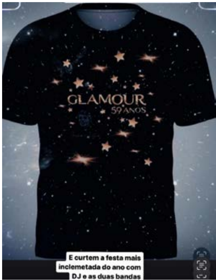
E curtem a festa mais inclementada do ano com DJ e as duas bandas

AS BELAS CAMISETAS para a grandiosa festa em comemoração aos meus 59 anos de jornalismo já estão à disposição de todos na ADATREND e Sapazzio da rua dr Veloso. Nos próximos dias colocarei nas outras Boutiques. Como sabem a festa do próximo dia 28 será superesportiva e pecos aos homens para irem de calça preta. As mulheres estarão como sempre arrasando com muito brilho. Volto a avisar que só terão acesso ao “Mirante Eventos” quem estiver vestido da mesma.