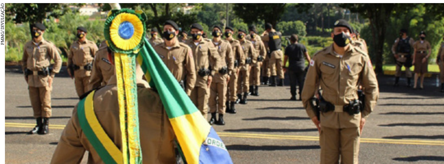
Convocação de aprovados em concurso vai fortalecer a segurança pública; formação de soldados começa a partir de 25/2

O Governo de Minas Gerais anunciou, nesta quinta-feira (17/2), 1.497 novos profissionais para a Polícia Militar de Minas Gerais (PMMG).