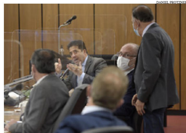
As emendas apresentadas ao PL 802/19 provocaram discussão entre os deputados

A criação do plantão digital também recebeu o apoio do deputado Duarte Bechir (PSD) e da deputada Ione Pinheiro (DEM). (Portal ALMG)