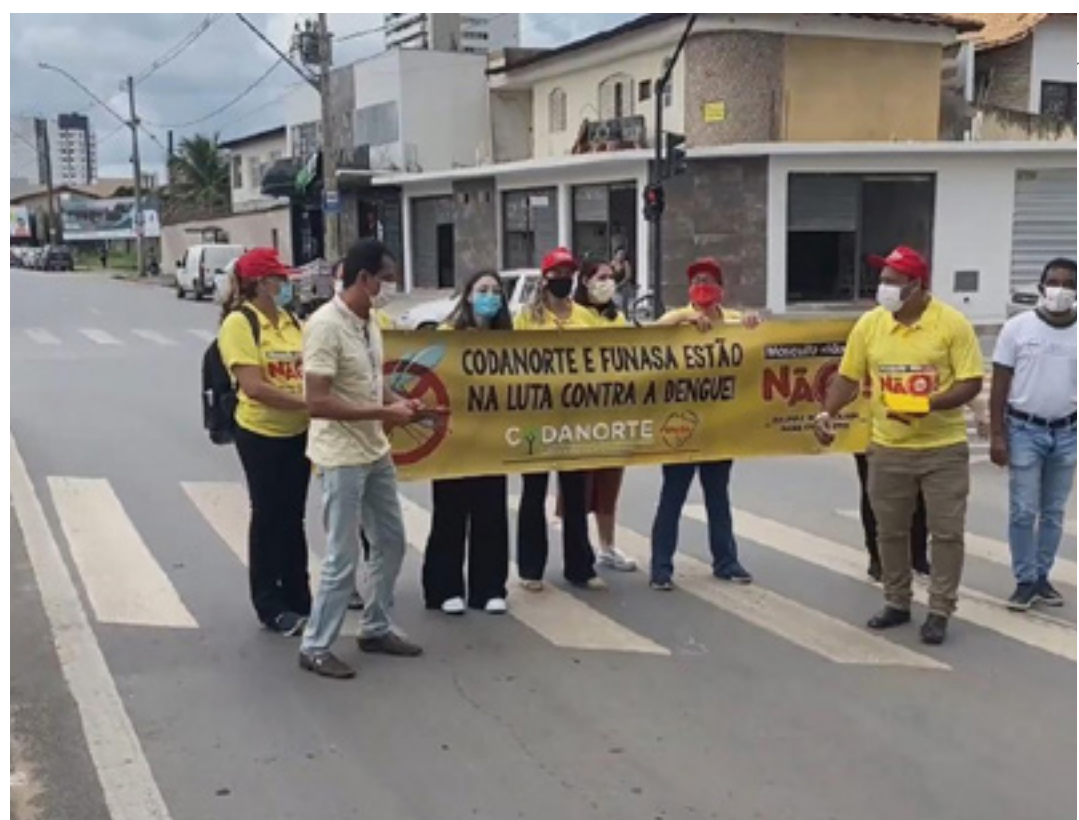
A ação realizada para conscientizar a população sobre as ações de prevenção

"Esse projeto é de fundamental importância para o Norte de Minas tendo em vista a abrangência desse convênio nesse enfrentamento dessa epidemia de dengue. O Codanorte é um dos pioneiros nessa atividade de desenvolver ações nos 18 municípios. Para se ter uma ideia, este é o único convênio que desenvolve essas ações em vários municípios. Na maioria das vezes, a Funasa fazia esse convênio diretamente com um município só. Então, com pouco recursos, nós vamos ter essa amplitude nas atividades que vão beneficiar todos esses municípios no enfrentamento da dengue e outras doenças. O Codanorte é um grande parceiro, que possui uma equipe