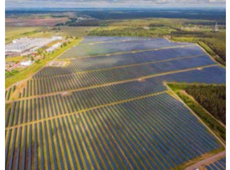
Estudo considera as grandes usinas de geração centralizada - GC (foto) e os pequenos e médios sistemas de geração distribuída - GD, instalados em telhados e áreas de residências, condomínios, comércios, indústrias e propriedades rurais (micro e minigeração)

É o melhor Estado para se investir, especialmente na região Norte, que lidera também a geração centralizada (grandes usinas e fazendas solares). “Orgulho em fazer parte dessas conquistas! Resultado de amplo trabalho e esforço ao longo da última década, que visam a Minas Gerais do futuro”,