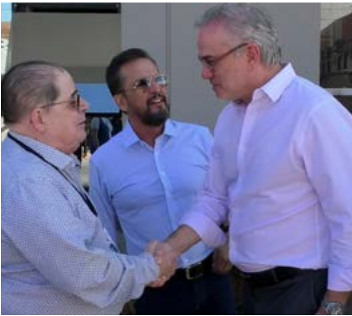
Diretor executivo da Eurofarma visita Hospital Arolto Tourinho