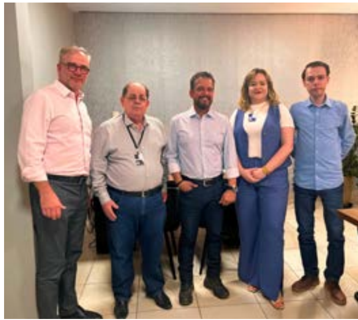
Gestores percorrem instalações do Hospital Arolto Tourinho