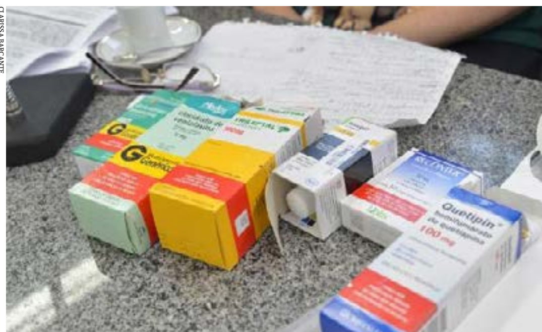
Durante o mês de maio, campanha pretende conscientizar sobre o uso de medicamentos