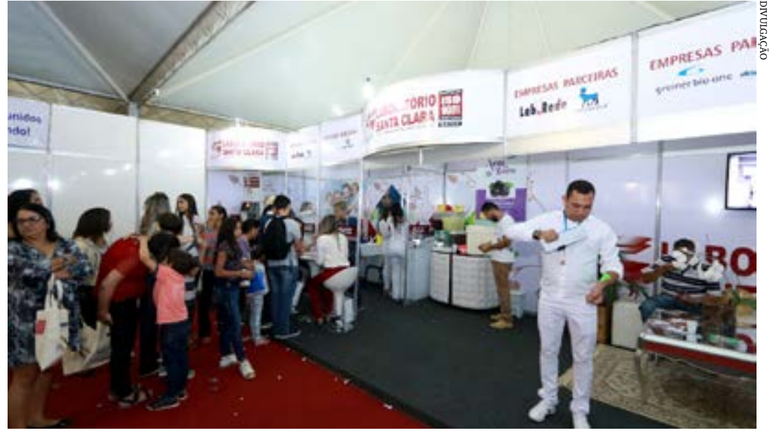
Após duas edições no ambiente digital, a feira volta a receber o público nos estandes

A Associação Comercial, Industrial e de Serviços de Montes Claros e a Fiemg Regional Norte realizam a maior feira de negócios do interior de Minas, a 27ª Fenics, de 15 a 18 de setembro, no Parque de Exposições João Alencar Athayde. Após a pandemia, com duas edições no modelo digital, a feira se reinventa para receber o público nos estandes. O lançamento será nesta terça-feira (17),