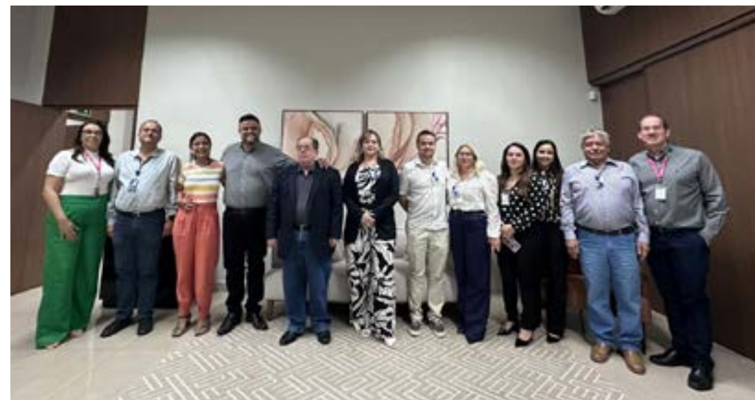
Gestores do Hospital Aroldo Tourinho se reúnem com novo Reitor da UnifipMoc Afya