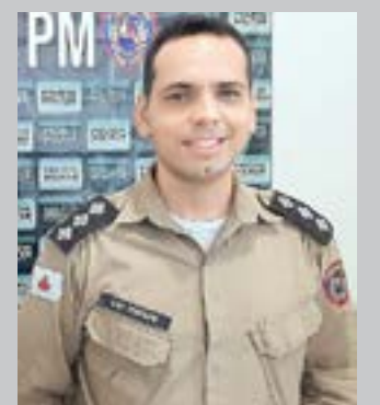
(*) Capitão PM – Comandante da 210ª Cia/10º Batalhão PM.

O "weekend" pode ser maravilhoso a todos nós! Todavia não saíamos por aí agindo como se fôssemos donos do mundo! Quando pararmos para ouvir alguém, que sejamos todos "ouvidos", que não estejamos ali apenas para compartilhar nossas experiências unilateralmente. Entretanto fiquemos atentos ao que o outro tem a dizer e sensíveis a interpretar a verdade que vá construir algo melhor. Pois ao inverso podemos destruir histórias que poderiam ser lembranças positivas por toda uma existência. Por conseguinte não ceifá-las na fraqueza, na insensibilidade e na pequenez desoladora se torna algo verdadeiramente louvável. Com efeito, será de grande valor dispor de ocasiões para falar com alguém que amamos do que perdê-la para o resto da vida por uma palavra ou por uma ação mal ajuizada.