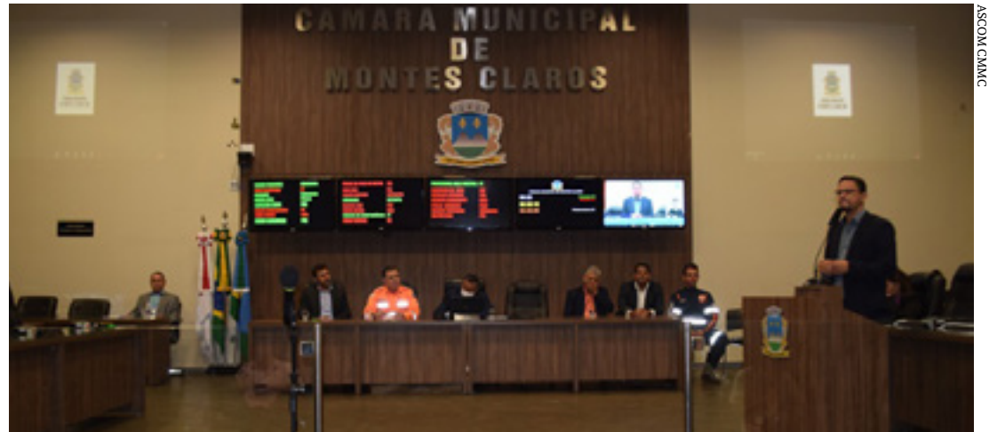
A audiência pública pedem melhorias para se evitar mais morte da rodovia que passa pelo Norte de Minas

A audiência contou com a participação de vereadores das cidades de Catuti, Francisco Sá, Grão Mogol, Rio Pardo de Minas, Salinas, São Francisco, Juvenília, Josenópolis, Padre Carvalho e Patís.