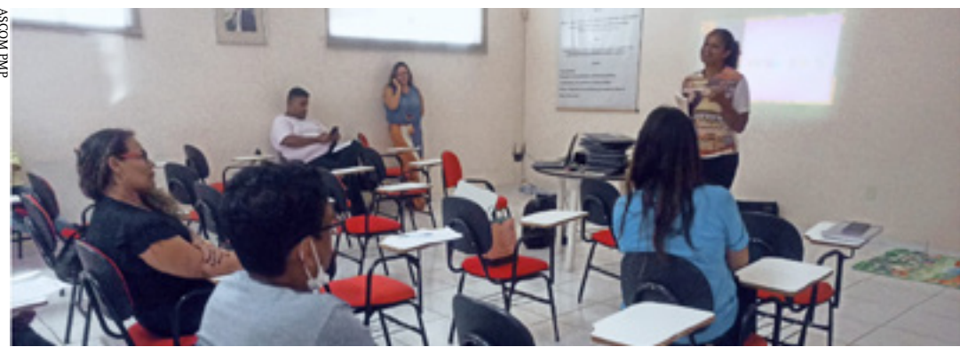
Semed se reuniu com dirigentes das unidades escolares, para implementar ações em comemoração ao aniversário da cidade

A Prefeitura de Pirapora está preparando uma grande programação para comemorar o aniversário dos 110 anos do município, no dia 01 de junho. Nesta mobilização especial está a Secretaria Municipal de Educação (Semed), que implementará ações na Rede Municipal de Ensino, para resgatar a história e as raízes de Pirapora, fortalecendo assim o orgulho piraporense e o sentimento de pertencimento na comunidade escolar.