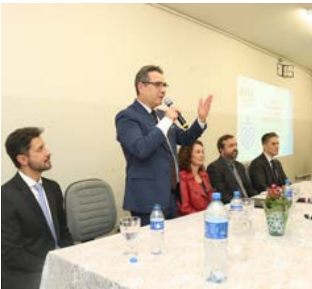
O reitor da Unimontes, Wagner de Paulo Santiago durante a abertura do Encontro Regional do MPMG em Montes Claros

Palestra foi ministrada no CEPT/Unimontes, com a participação de promotores e estudantes de Direito