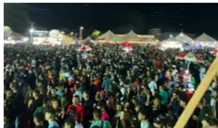
EU TIREI ESTÁ FOTO quando estava no amplo camarote mostrando parte da multidão que sempre bate recorde de presenças na EXPOJANAÚBA. Vamos lá dia 30