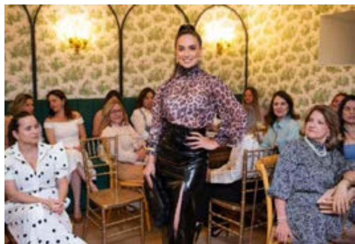
BELAS MODELOS desfilaram com a nova coleção