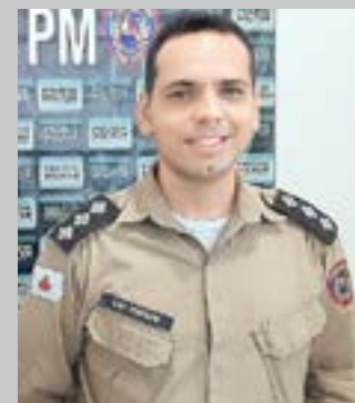
(*) Capitão PM – Comandante da 210ª Cia/10º Batalhão PM.

Há muita terra fértil e, por vezes, insondada em nossa mente. Deus dá colheita a quem planta! Sem dúvida alguma para que tenhamos resultados, para que apresentemos nossos talentos é preciso semear! A semeadura se dá com a dedicação aos estudos, com o compromisso consigo mesmo e com os outros. Com certeza existe algo que fazemos com tamanha destreza que muitos outros não sabem ou não fazem bem. Mas só saberemos disso se nos dispusermos a caminho, ou como falam alguns antigos: “Meu filho, põe o pé no caminho!” Enquanto estivermos estáticos, não haverá o que contemplar de bom! Como diz o provérbio popular: “quem semeia vento, colhe tempestade”. Todo e qualquer pensamento negativo ou de insensatez se esvai quando definitivamente adotamos uma decisão e partirmos a realizar, a agir, a fazer o que deve ser feito, sem temor, sem supervalorizar obstáculos. Todavia essa força está no interior de cada um de nós e depende apenas de nós potencializarmos tais habilidades que poderão fazer de fato o bem a alguém ou quem sabe a toda a humanidade.