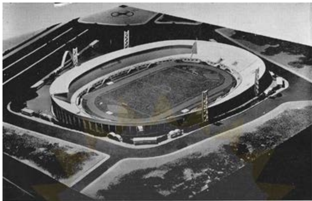
ESTADIO DO CLUBE ATLETICO MINEIRO - Belo Horizonte Arq. Icaro de Castro Mello Oswaldo Correa Gonçalves

O Estádio Olímpico da Pampulha tinha previsão inicial de inauguração para 25 de março de 1948, em comemorações ao 40º aniversário do Galo, visando também a sede da Copa do Mundo de 1950. O projeto nunca saiu do papel, e o estádio Independência acabou sendo construído para a Copa daquele ano. Confira na imagem o projeto do estágio que seria construído. (G1)