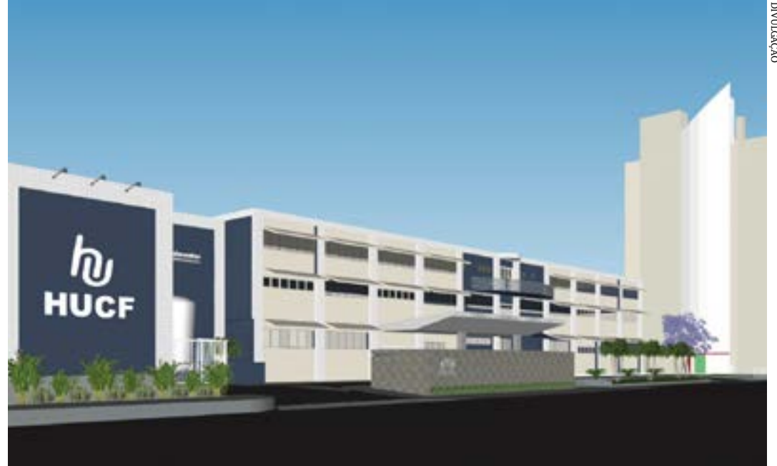
Nova fachada principal do Hospital Universitário da Unimontes (Avenida Cula Mangabeira)

A humanização em um hospital não se restringe apenas no acolhimento e no tratamento dos pacientes. Também se estende ao visual do ambiente. Com essa consideração, o Hospital Universitário Clemente de Faria (HU - Unimontes), vinculado à Universidade Estadual de Montes Claros, teve um momento marcante nesta quinta-feira (25/04): foi realizada a assinatura da ordem de serviço para implantação do projeto de paisagismo do hospital. As obras, orçadas em R$ 272,7 mil, deverão ser concluídas até agosto próximo.