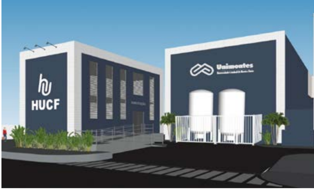
Parte da nova fachada principal do Hospital Universitário da Unimontes com a substituição de tratamento (Avenida Cula Mangabeira)

Objetivo é revitalização das áreas externas, refletindo na melhoria do visual e na humanização do ambiente