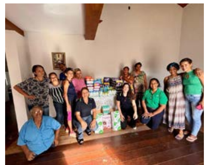
Campanha Dignidade Menstrual, promovida por voluntários da Cemig, vai doar mais de 18 mil unidades de absorventes femininos a instituições de apoio e acolhimento e meninas e mulheres em situação de risco social. Na foto, a instituição Casa de Acolhimento Rosa Mística, de Montes Claros, recebe as unidades de absorventes femininos.