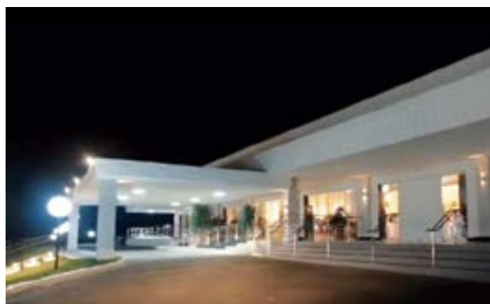
ESTE ANO NAS COMEMORAÇÕES de mais três décadas de sucesso, a “FEIJOADA DO THEO” terá como palco o maravilhoso salão de baile do “Mirante Eventos”.