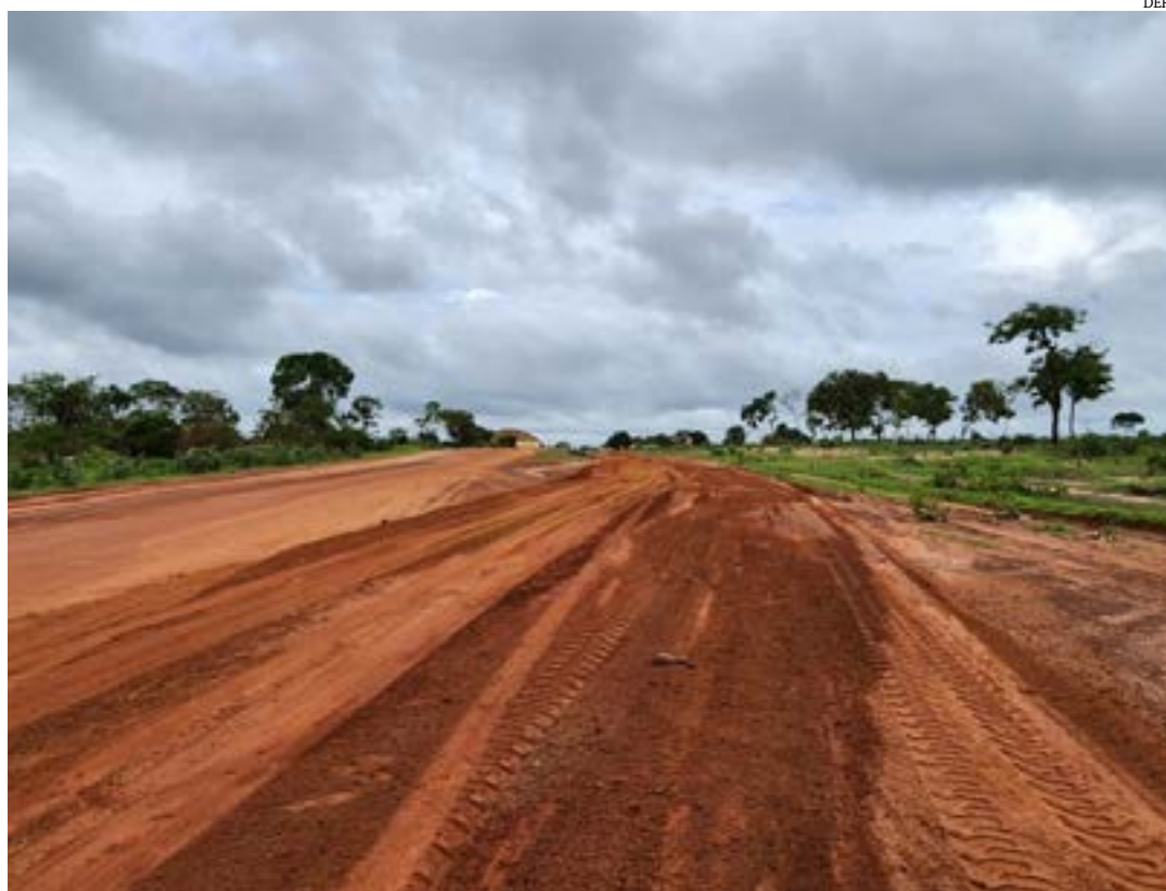
Obra vai beneficiar diretamente cerca de 100 mil mineiros e gerar 130 novos postos de trabalho durante os serviços

Além das 56 obras concluídas, 46 empreendimentos estão em execução, o que corresponde a 36% do conjunto de intervenções e as demais 22 obras (17%) devem ser iniciadas ao longo dos próximos meses. Convertendo em quilometragem, já são 1.548,7 quilômetros de obras concluídas e outros 1.584,8 quilômetros em andamento. (Com informações da Agência Minas)