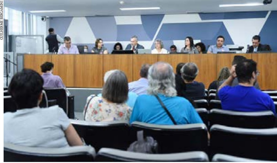
Comissão de Participação Popular ouviu especialistas e pacientes diagnosticados antes da terceira idade

Vencer a subnotificação dos casos e compreender que o Parkinson não é uma doença exclusiva da terceira idade foram demandas apresentadas em audiência pública que apontou nesta quinta-feira (4/4) os desafios enfrentados por pacientes e profissionais de saúde.