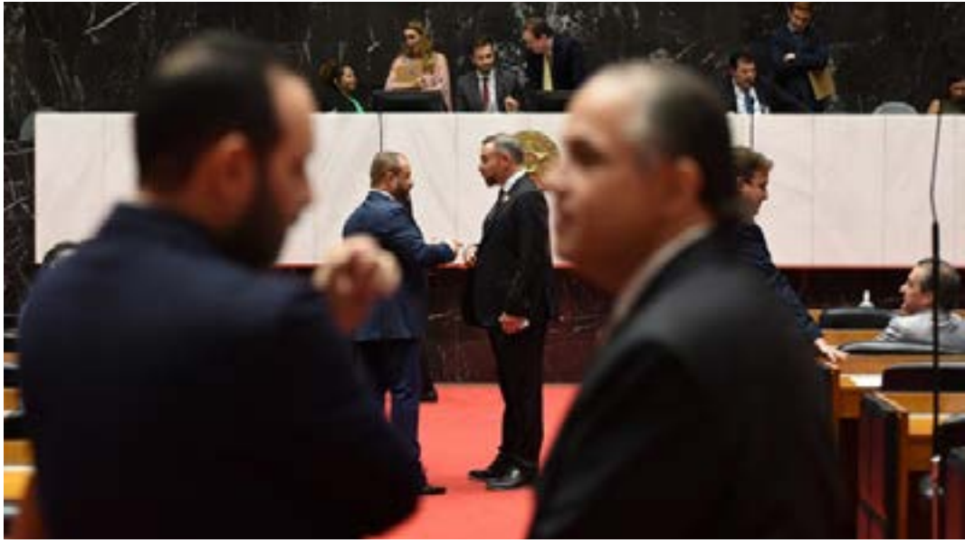
Alguns dos vetos do governador encontraram resistência de parte do Plenário da Assembleia

Em reunião extraordinária no final da tarde dessa terça-feira (2/4), o Plenário da Assembleia Legislativa de Minas Gerais (ALMG) decidiu manter três vetos do governador a propostas relacionadas à cobrança de pedágio em rodovias, concessão de crédito consignado e isenção de taxas cobradas por cartórios de protesto.