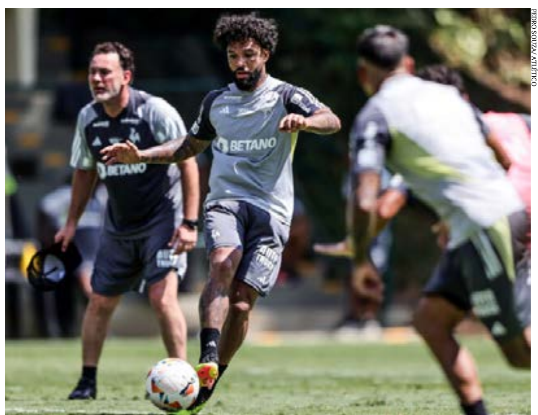
Treino do Atlético na Cidade do Galo nessa segunda-feira (1º/4)