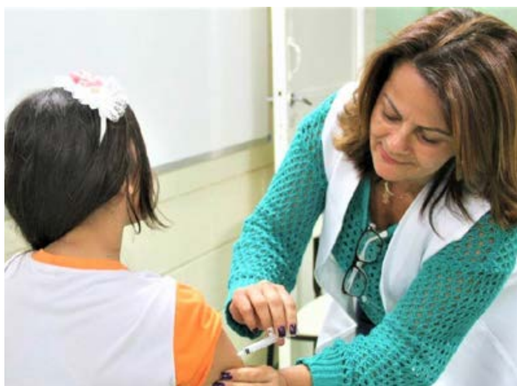
Estratégia busca intensificar proteção contra o câncer de colo de útero e outras complicações associadas ao vírus e permite dobrar a capacidade de imunização com o estoque atual da pasta

Em 2023, foram aplicadas mais de 6,1 milhões de doses da vacina contra o HPV. O número é o maior desde 2018 (5,1 milhões) e representa um aumento de 42% em relação a 2022, quando foram aplicadas pouco mais de 4 milhões de doses. Essa retomada é fruto do esforço de estados e municípios que se juntaram ao Ministério da Saúde no Movimento Nacional pela Vacinação, revertendo a tendência de queda nas coberturas dos principais imunizantes do calendário definido pelo PNI.