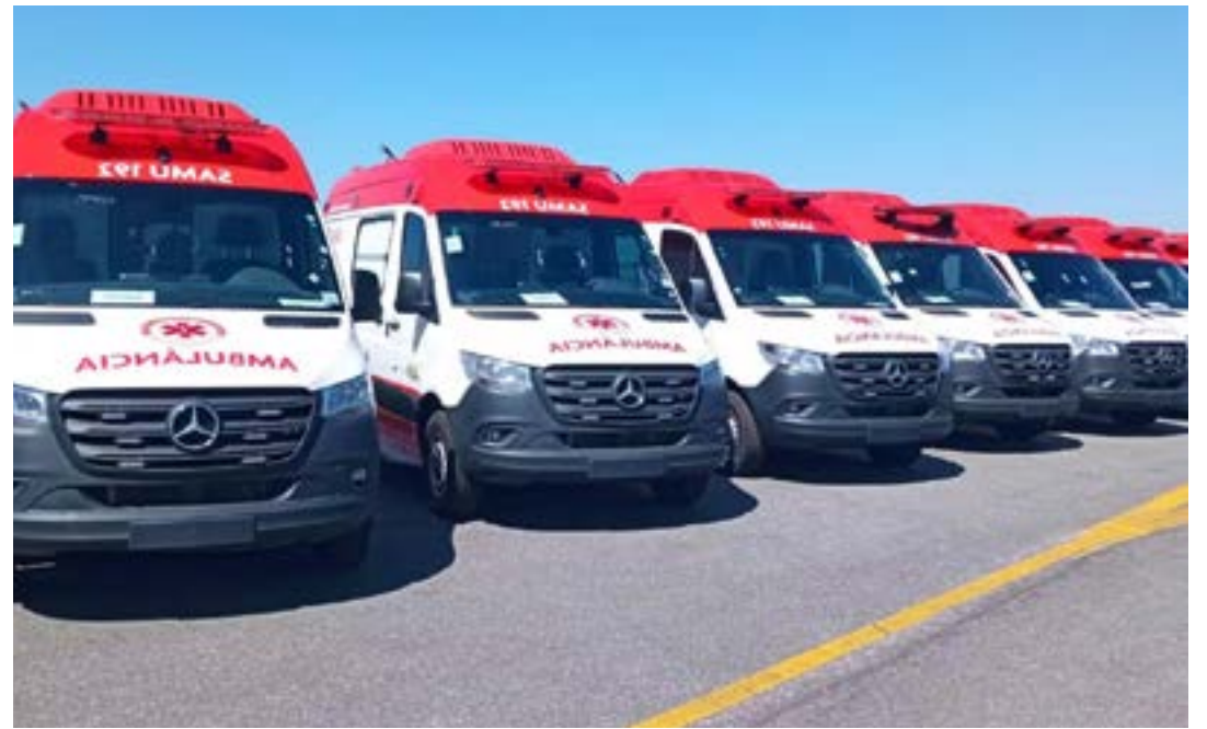
Com cerca de 14 mil habitantes, Chapada Gaúcha foi um dos municípios contemplados com ambulância do Samu e inscrita na Central de Regulação de Urgências

Os critérios de seleção de propostas de construção de Centrais levaram em conta as Macrorregiões de Saúde sem cobertura de SAMU 192 e o menor percentual de cobertura do SAMU 192 na Região de Saúde. (Com informações do Ministério da Saúde)