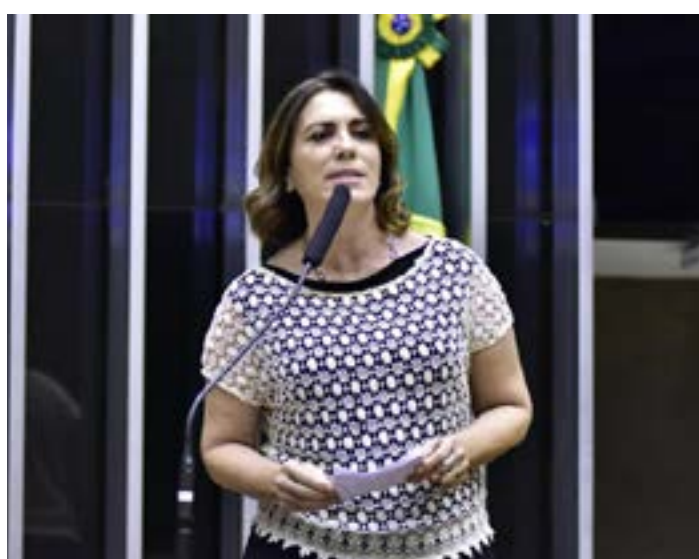
Rosana Valle: é essencial corrigir a distorção existente hoje

O projeto será analisado, em caráter conclusivo, pelas comissões de Segurança Pública e Combate ao Crime Organizado; de Finanças e Tributação; e de Constituição e Justiça e de Cidadania. ( Agência Câmara )