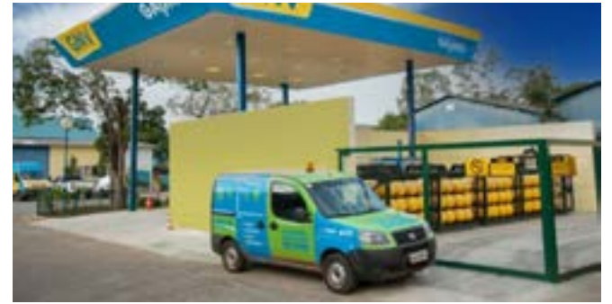
A Companhia de Gás de Minas Gerais (Gasmig) realiza investimentos da ordem de R$ 3 milhões para ampliar os corredores de Gás Natural Veicular (GNV) em Minas

Principais destaques dos jornais integrantes da Rede Sindijori MG