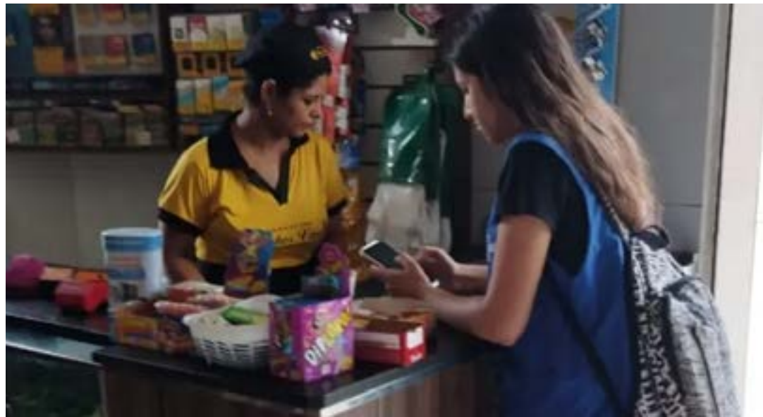
Agentes começaram o mapeamento dos pequenos negócios em janeiro

Iniciativa do Sebrae Minas e Sedese tem objetivo de impulsionar pequenos negócios, gerar emprego e renda em vilas e favelas