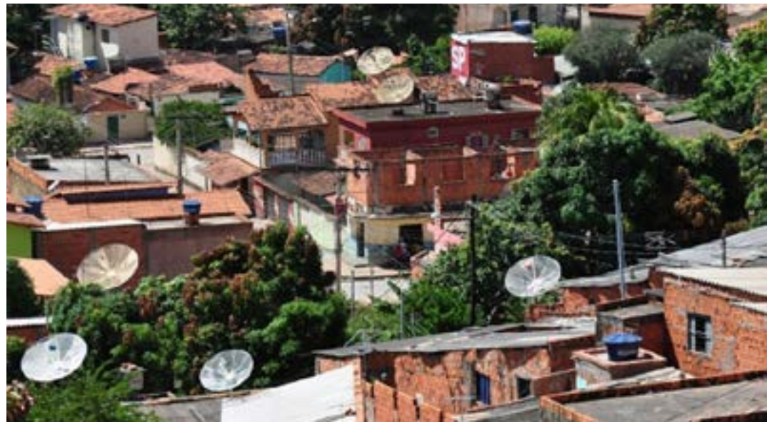
Cidade Cristo Rei conta com cerca de 3,3 mil moradores

Em Montes Claros, o programa irá beneficiar também moradores dos bairros Alto São João, Vila Ipiranga, Esplanada, Renascença, Vila Exposição, São José, Monte Carmelo, Vila Regina e Vera Cruz. Após o mapeamento, feito pelos Agentes de Comunidades, serão realizadas ações personalizadas com foco em modelagem de negócios, marketing, finanças, vendas e orientação sobre formalização, entre outras iniciativas.