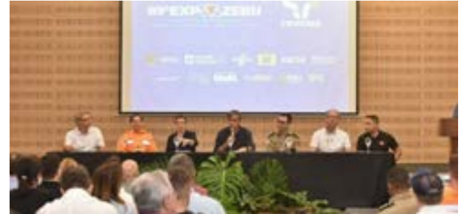
Evento traz novidades tecnológicas, implementos e insumos agrícolas, além de abordagem e soluções de práticas sustentáveis para os cafeicultores