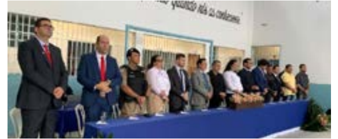
- Solenidade marcou a inauguração da ala do regime fechado que custou investimentos de R$ 380 mil