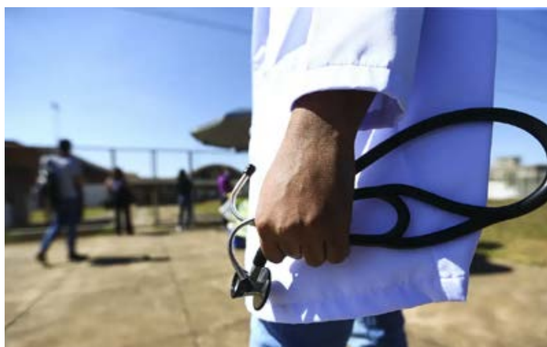
Imagens de pacientes poderão ser divulgadas, mas com autorização

As mesmas regras valem para clínicas ou hospitais. As novas normas permitem que um médico ou clínica divulgue a aquisição de um aparelho importado que não tem similar no Brasil. Antes, isso não era permitido porque gerava concorrência desleal em relação aos demais. “Hoje pode-se divulgar uma técnica, um equi-