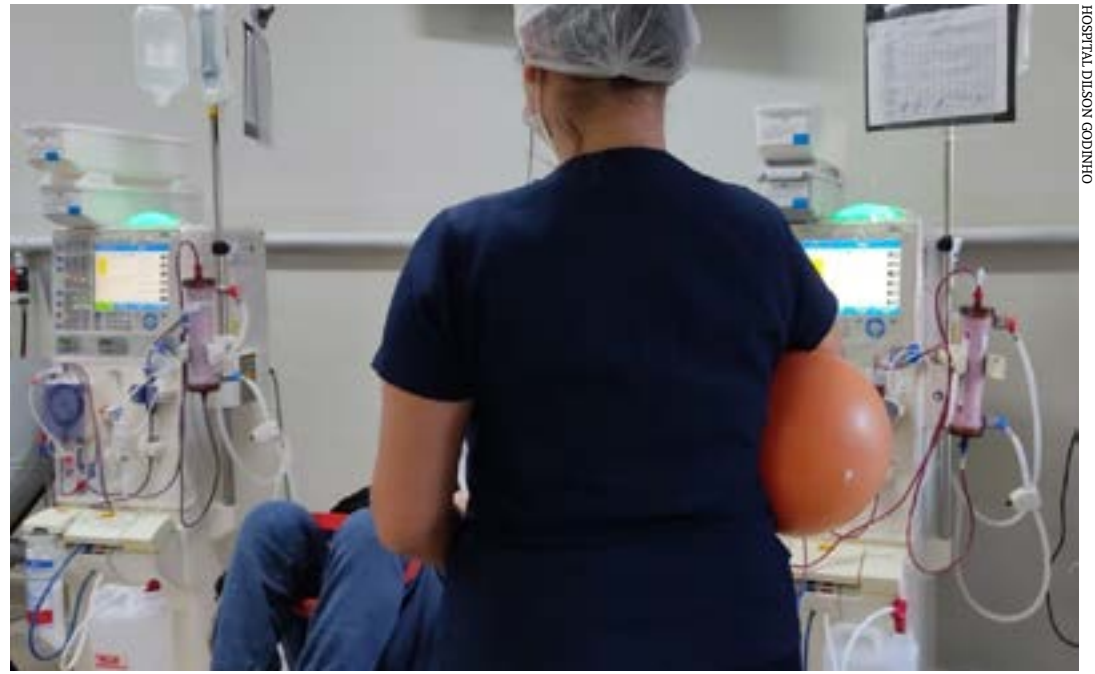
HOSPITAL DILSON GODINHO

As unidades de Nefrologia do Hospital Dilson Godinho (HDG) em Montes Claros, Salinas e Pirapora realizam durante esta semana, diversas ações pelo Dia Mundial do Rim, comemorado na segunda quinta-feira de março, e que este ano, será dia 14/3.