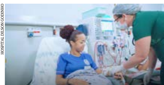
HOSPITAL DILSON GODINHO

HDG realiza ações no Dia Mundial do Rim em MOC, Salinas e Pirapora