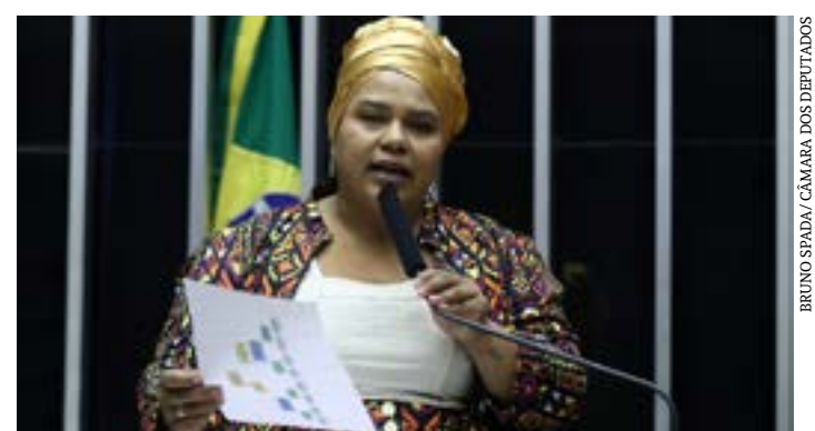
Dandara defende resposta coordenada para enfrentar aumento dos casos da doença

O PL 351/24 será analisado, em caráter conclusivo, pelas comissões de Defesa do Consumidor; de Previdência, Assistência Social, Infância, Adolescência e Família; de Saúde; de Finanças e Tributação; e de Constituição e Justiça e de Cidadania. (Agência Câmara)