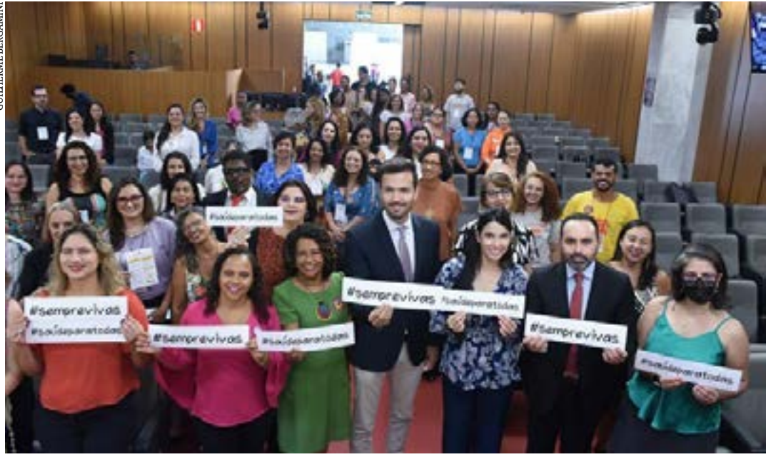
O ciclo de debates vai abordar questões como as condições de trabalho das mulheres, violência de gênero e desafios para a representatividade feminina na política

Para marcar o Mês da Mulher na ALMG, a fachada do Palácio da Inconfidência, sede do Poder Legislativo, será iluminada com a cor lilás entre segunda (4) e domingo (10). Ao longo do mês, o Sempre Vivas terá ainda quatro encontros regionais no interior do Estado, em programação a ser definida. (Portal ALMG)