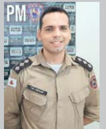
(*) Capitão PM – Comandante da 210ª Cia/10º Batalhão PM.

Por conseguinte, podemos dizer, por exemplo, que não é raro encontrarmos discussões e desentendimentos acalorados nas vias de trânsito urbano. De outro modo alguns também não sabem e nem se interessam por se colocarem à disposição para auxiliar um pobre mendigo que perambula nas ruas sem o que comer e sem o que vestir; não sabemos por vezes quais são as necessidades do nosso bairro, pois permanecemos fechados em nossas residências, como se de alguma forma o mundo lá fora não existisse. Sem um gesto de empatia, de procurarmos pelo menos ouvir o outro em suas aflições jamais conseguiremos alcançar a compreensão do ser cidadão. De certo que nessa lida pelo menos prestar a devida atenção, demonstrar que todos nós somos iguais e que habitamos o mesmo planeta e dele usufruiremos juntos. Infelizmente só tendemos a olhar o outro, quando o nosso ego foi atingido, quando estamos em dificuldades, quando estamos sensíveis em razão de perdas ou enfermidades que assolam os que nos são caros. Ser cidadão é muito mais que obrigação e direito. Ser cidadão, sobretudo é ser humano e buscar zelar pelo bem a todos comum.