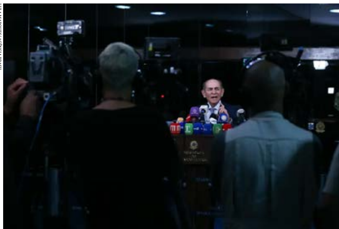
Mudança será por três emendas à Constituição

A eleição geral ocorreria 2034, depois em 2039, 2044, 2099; todas seguindo o mandato de 5 anos. Em todas as propostas, os mandatos de vereadores, deputados estaduais e federais seriam de 5 anos e os senadores teriam mandato de 10 anos.