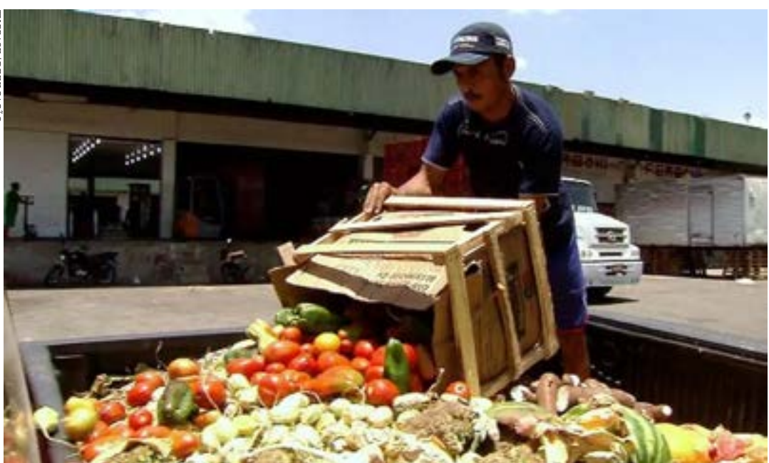
Perdas são responsáveis por 10% das emissões de gases de efeito estufa

Contato: fomentamoc@gmail.com (38) 9 9130 8376