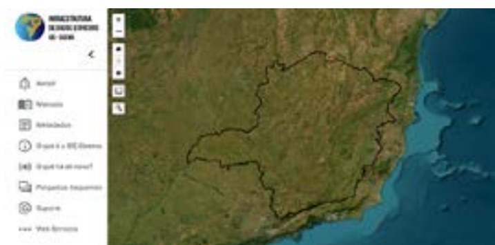
Com mais de 1000 camadas de dados disponíveis, a IDE se consolidou como uma das mais importantes para tomadas de decisões por parte dos órgãos do Estado

Tão crucial quanto a visualização dos dados é o catálogo de metadados da IDE-Sisema. Nesse recurso, os usuários têm acesso a uma extensa gama de informações detalhadas sobre os dados disponíveis na plataforma.