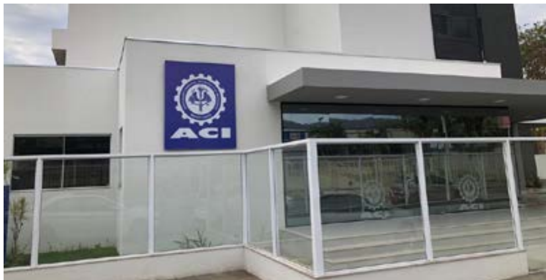
O evento acontece na sede da ACI, a partir das 19h30