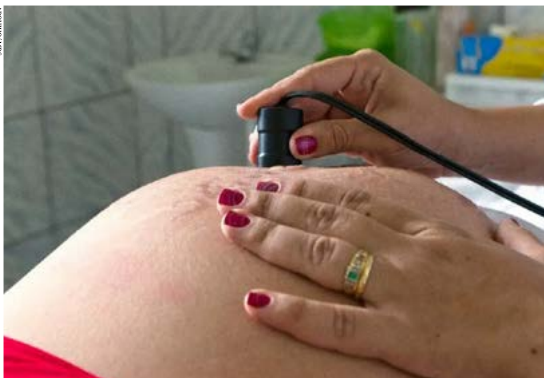
Casos em gestantes e crianças devem ser comunicados obrigatoriamente

às diretrizes da Organização Mundial de Saúde (OMS), da Agenda 2030 da Organização das Nações Unidas (ONU) e da Organização Pan-Americana da Saúde (Opas). (PAULA LABOISSIÈRE/ Repórter da Agência)