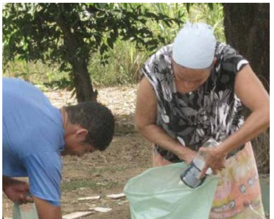
Proprietários rurais devem evitar o surgimento de criadouros do mosquito transmissor

chegar à forma adulta. Febre, dores nas articulações, erupções ou irritação na pele são alguns dos sintomas mais comuns da dengue, zika e chikungunya. Em caso de agravamento dos sintomas, é preciso procurar atendimento médico. (FLÁVIA FREITAS/ Emater-MG)