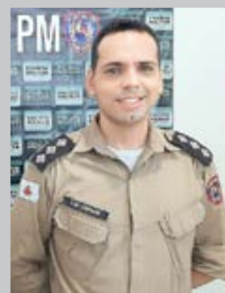
(*) Capitão PM – Comandante da 210ª Cia/10º Batalhão PM.

Pouco antes da refeição, o pai do menino de quatro anos de idade, viu o garoto com umas sucatas de maneira e perguntou a ele de maneira dócil e educada o que estava fazendo. O menino então respondeu com carinho e docilidade: "pai, estou fabricando uma tigela de madeira para você e mamãe para quando eu crescer lhes entregar!" Aquilo foi como a um golpe ao entrar no ouvido daqueles pais que ficaram mudos. E quem olhasse poderia ver as lágrimas caírem de seus rostos. Mas imediatamente souberam o que fazer. Conduziram o avô naquela hora à mesa de refeição central e por qualquer razão nem o filho, nem a nora ficaram mais nervosos com as dificuldades que o avô apresentava na hora de se alimentar. O que podemos aprender com essa história é no mínimo a cultivar melhor a paciência; reconhecer os erros e a pedir perdão. Lembramos ainda que as crianças intuitivamente prestam atenção em tudo o que acontece em casa e tendem a repetir as mesmas atitudes dos pais, quando se tornam adultos. Por fim não esqueçamos sempre de agradecer, pois a gratidão é a memória do coração.