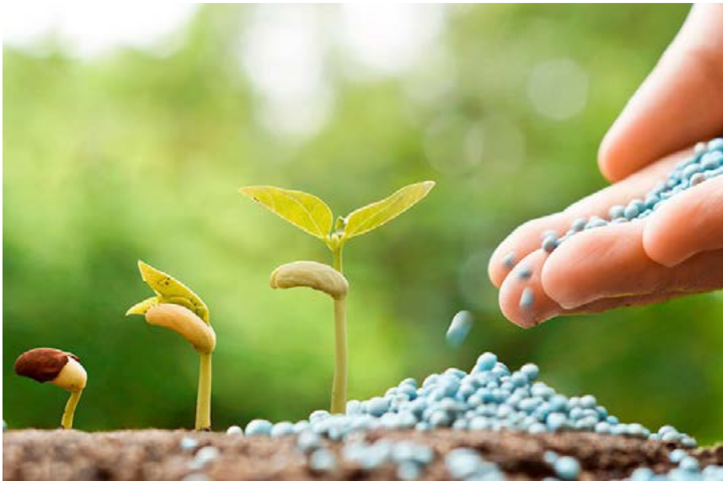
Uma das propostas prontas para votação cria incentivos para desenvolver a indústria de fertilizantes no Brasil

Neste início de ano legislativo, a Comissão de Agricultura e Reforma Agrária (CRA) se prepara para votar projetos sobre regras para o licenciamento ambiental, incentivo à indústria nacional de fertilizantes e destinação de florestas públicas, entre outros temas. Oito proposições estão prontas para votação no colegiado, presidido pelo senador Alan Rick (União-AC).