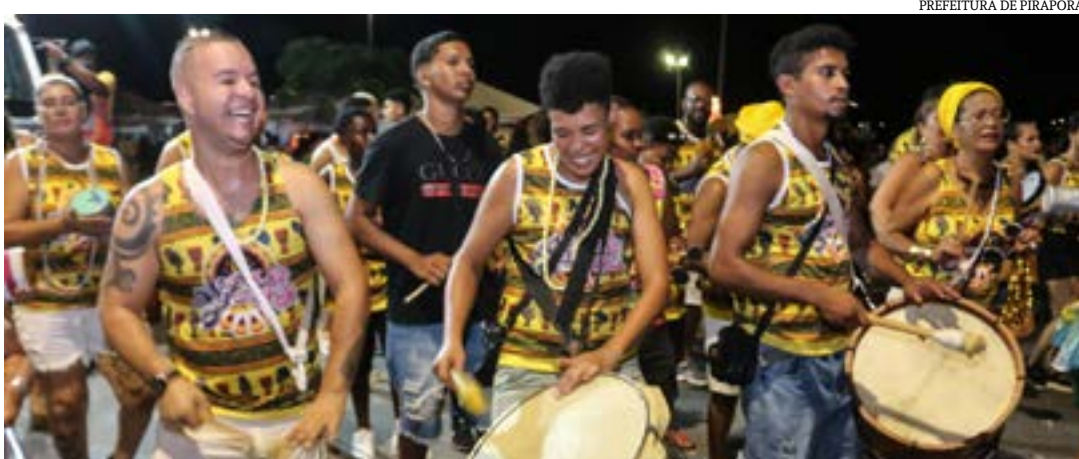
PREFEITURA DE PIRAPORA