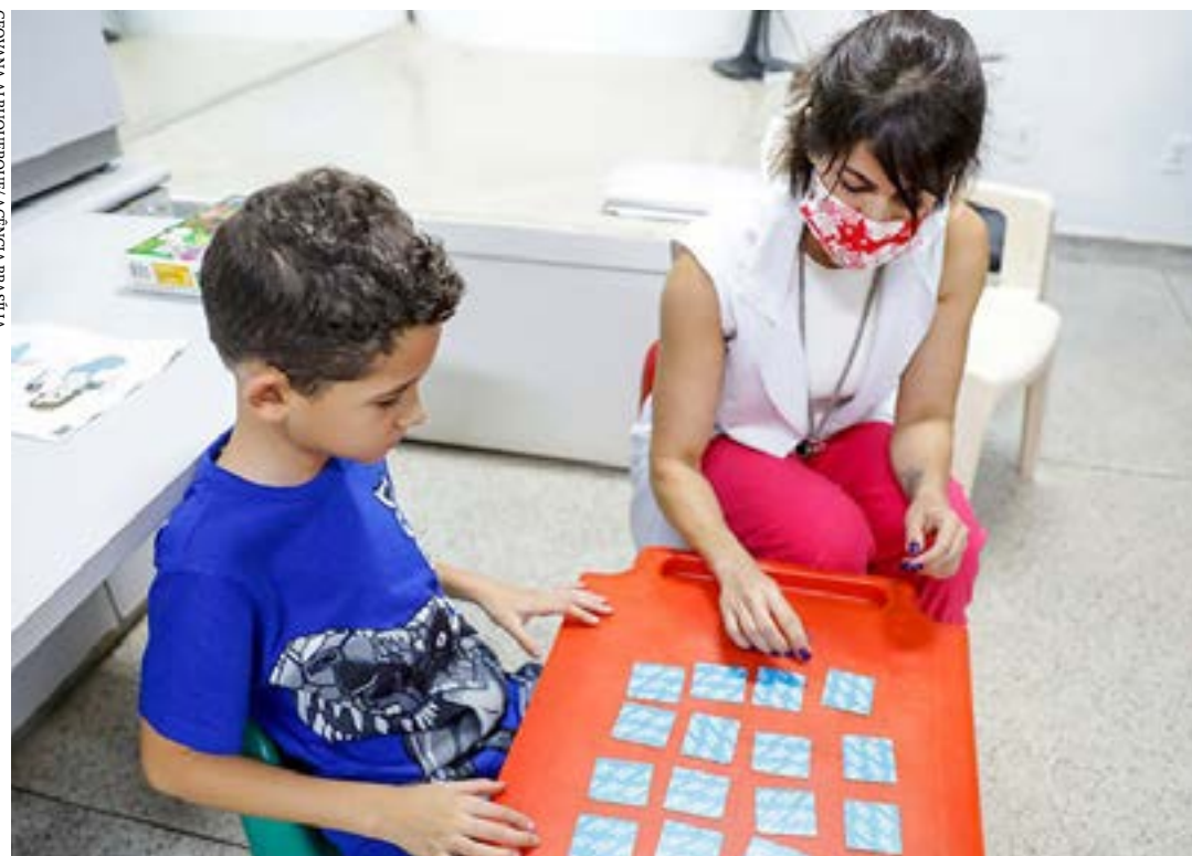
Renovação de laudos para a obtenção de benefícios causa transtorno às famílias de autistas

A avaliação de políticas públicas pelas comissões do Senado foi instituída pela Resolução 44/2013. Desde então, o Regimento Interno da Casa passou a prever como competência das comissões permanentes escolher anualmente políticas públicas no âmbito do Poder Executivo para serem avaliadas. (Agência Senado)