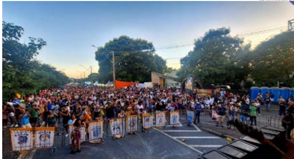
O encontrão dos blocos carnavalescos de Montes Claros, realizado domingo depois das 15 horas, arrastou aproximadamente 18 mil pessoas, puxados pelos 11 blocos que se apresentaram na 'Passarela da alegria', em frente ao parque Sagarana.