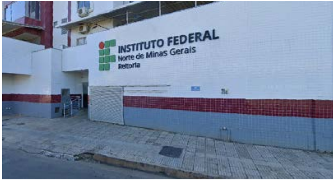
GOOGLE STREET VIEW

O candidato aprovado terá uma jornada de 30 horas semanais (se-