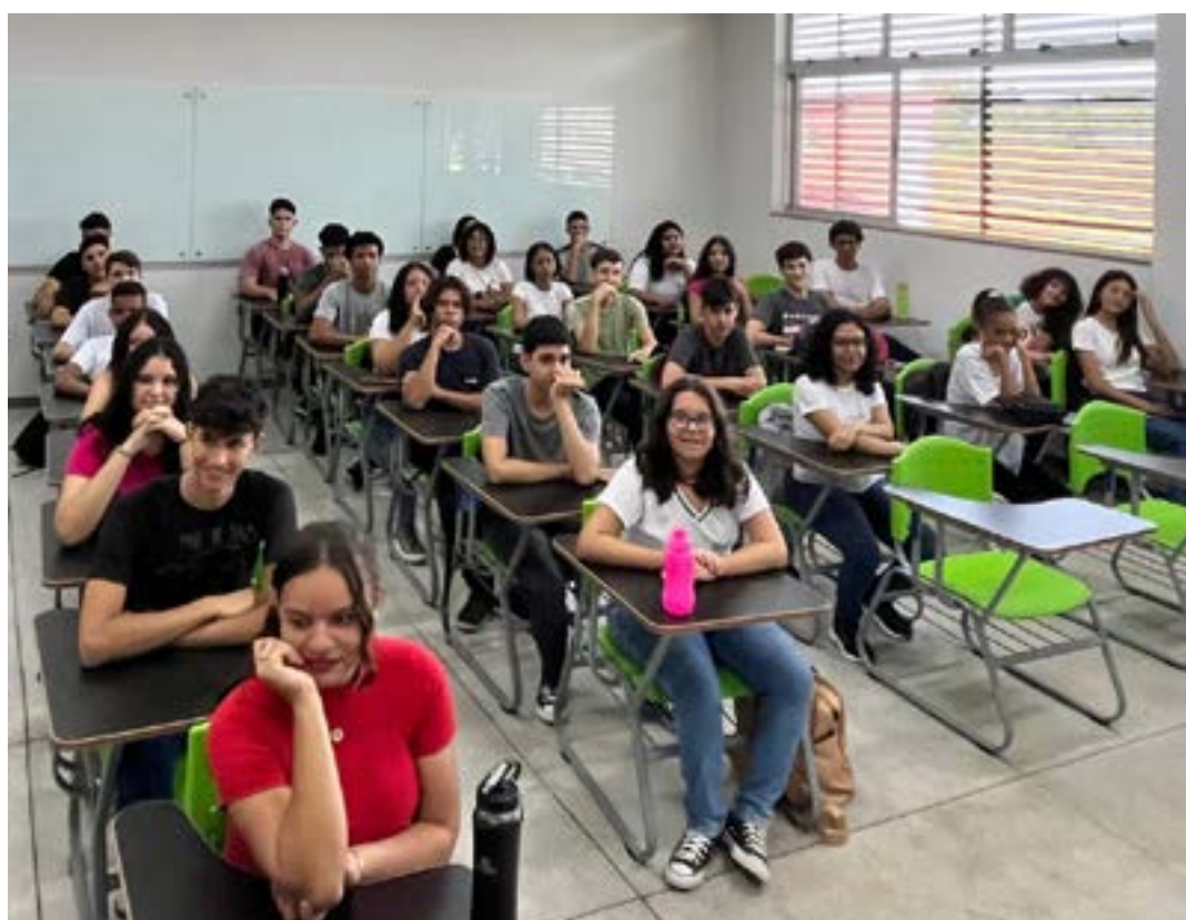
Primeiro dia de aula na nova sede do IFNMG-Campus Avançado Janaúba

O diretor do Campus explica que, para atender estudantes e servidores do IFNMG-Campus Avançado Janaúba, a Prefeitura Municipal e a empresa WC Transporte de Janaúba estenderam uma das linhas de transporte público até o novo campus, com funcionamento a partir desta quarta-feira. Segun-