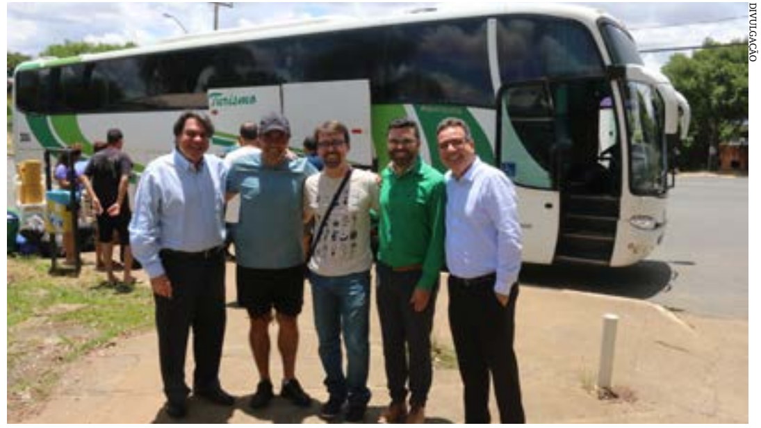
Reitor recebe equipe de acadêmicos e professores e destaca êxito das ações

Até esta quarta-feira (7), a população de Serranópolis de Minas recebeu oficinas, palestras e outras atividades desenvolvidas por acadêmicos da Universidade Estadual de Montes Claros, supervisionados por professores, em nova edição do Projeto Unimontes Solidária.