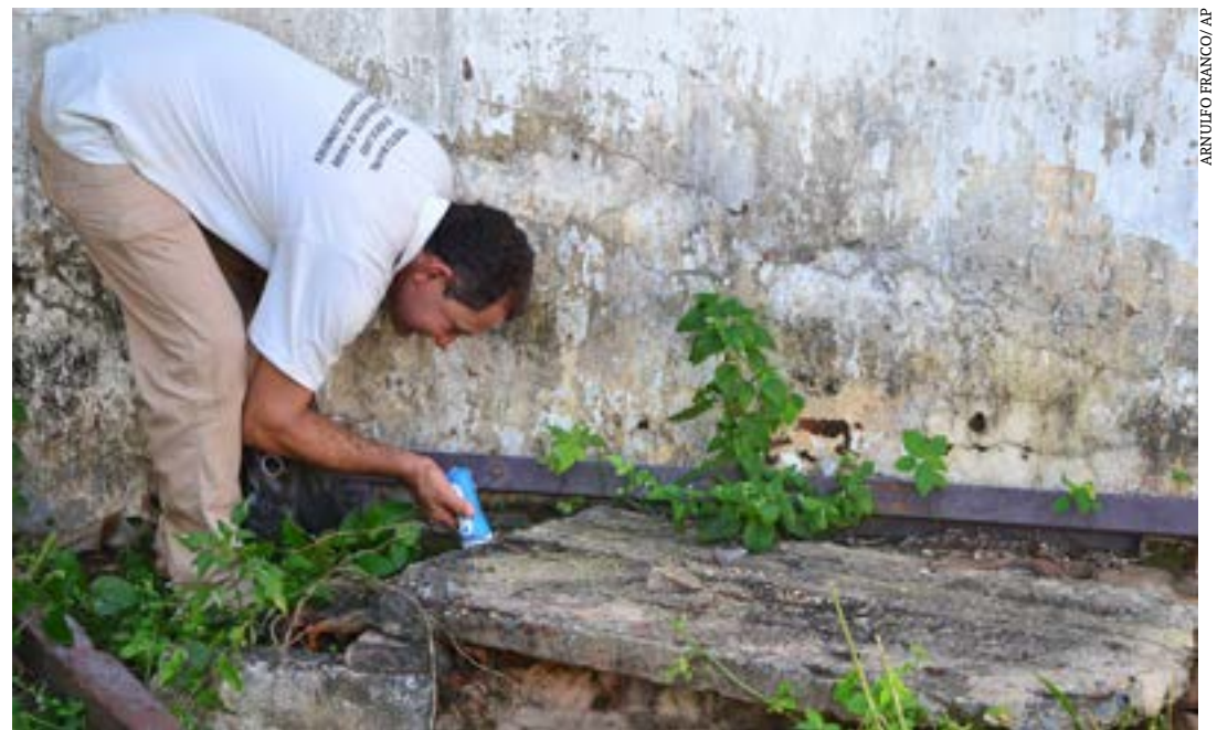
Apesar das ações de prevenção, número de casos da doença na cidade vem crescendo ao longo das semanas

Embora não esteja em funcionamento, existem guardas e vigias no local, e a equipe do CCZ responsável pelo território monitora o espaço. Quando focos são encontrados, os agentes os eliminam, prevenindo a reprodução do mosquito.