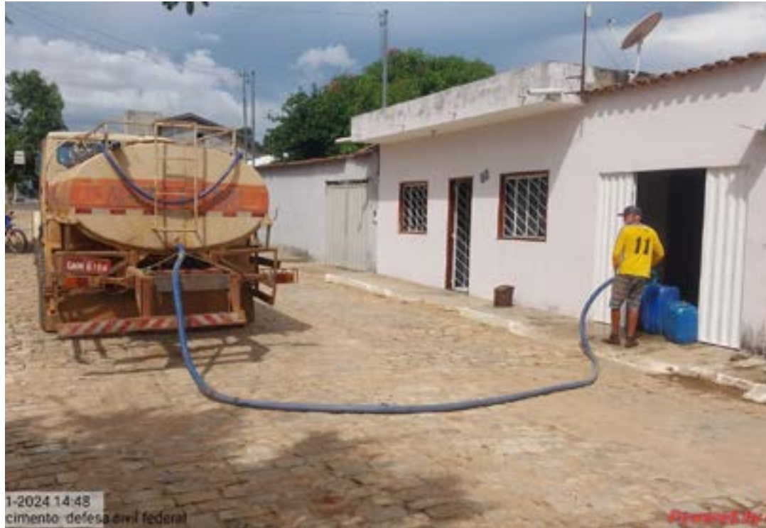
Medida se tornou realidade após discussão na Amams

ços artesanais. Outra definição do Governo Federal que a Amams cobra e aguarda com grande expectativa é a medida provisória para renegociação das dívidas rurais, para quem teve perdas por causa da seca.