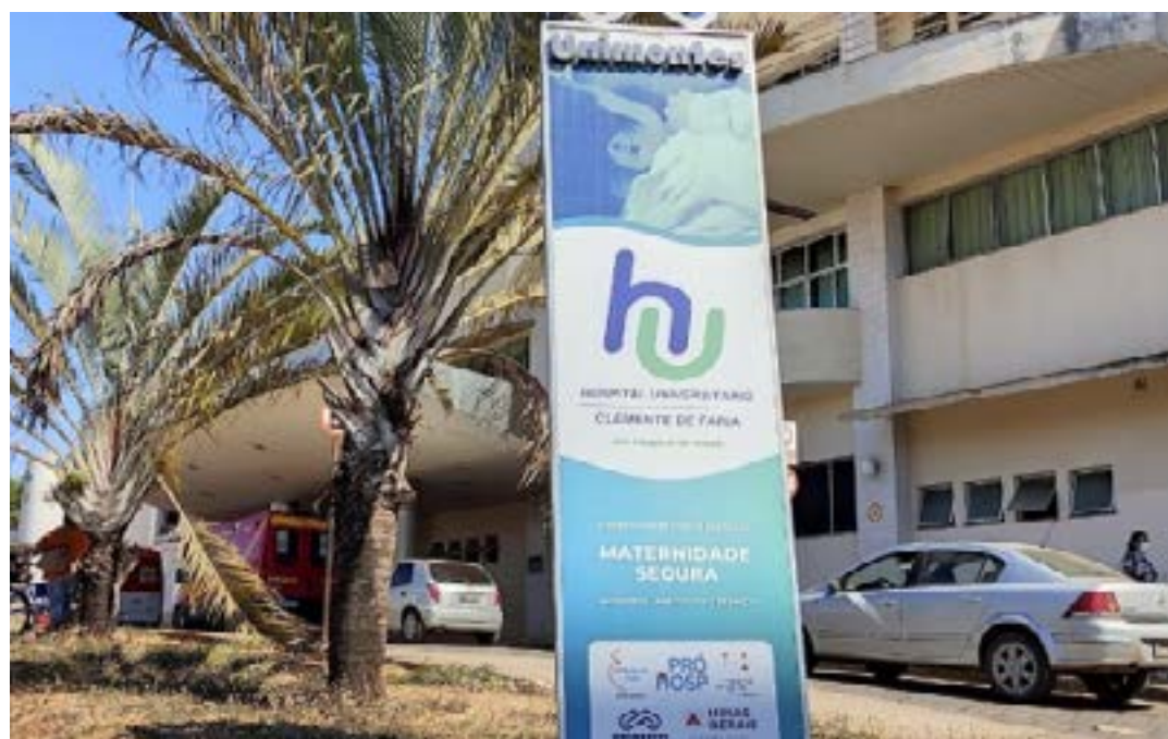
O mosquito Aedes aegypti , que transmite as duas doenças para o ser humano

Ao aderirem ao projeto, os hospitais e as secretarias municipais de saúde passarão a integrar a Plataforma SES-MG de Monitoramento Hospitalar, pela metodologia de Grupos de Diagnósticos Relacionados. Os hospitais receberão incentivo financeiro para a aquisição da Licença do Sistema Agrupador da Metodologia de Grupos de Diagnósticos Relacionados. Em junho os hospitais deverão fazer a aquisição da licença do software e do Sistema de Gerenciamento de Banco de Dados. A partir de julho, será iniciada a qualificação dos analistas de in-