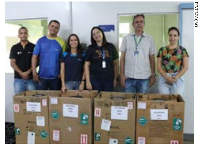
Comercialização de 40 mil doses de sêmen de Gir Leiteiro para o país asiático abre novos precedentes para a expansão do comércio e melhoramento genético internacionais

COLUNA | MG Rede Sindijori MG - www.sindijorimg.com.br Principais destaques dos jornais integrantes da Rede Sindijori MG