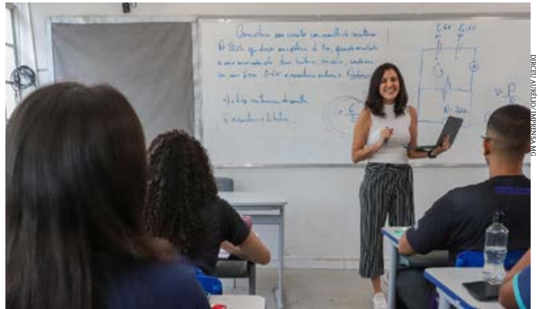
Serão disponibilizados os editais das vagas que não foram preenchidas na primeira e segunda rodadas online de convocação e contratação temporárias

O processo presencial de contratação e convocação temporárias de profissionais que irão compor o quadro de pessoal da rede estadual iniciará nesta quarta-feira (31/1) e seguirá vigente ao longo do ano letivo de 2024, para atender as unidades de ensino, mediante o surgimento de vagas. (Agência Minas)